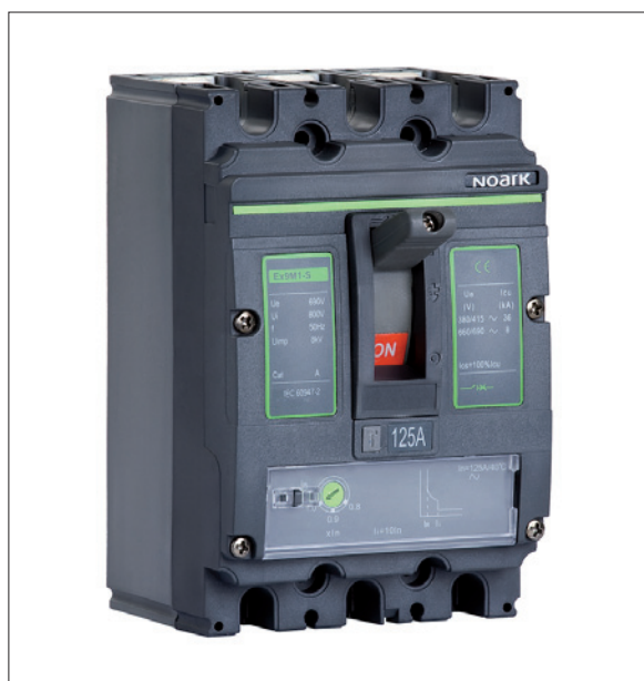
Obr. 3. Kompaktní jistič

vojem, výrobou a distribucí elektrotechnických přístrojů a komponentů. Praha se tak stává vedle Chicaga a Šanghaje jedním z regionálních obchodních center společnosti.