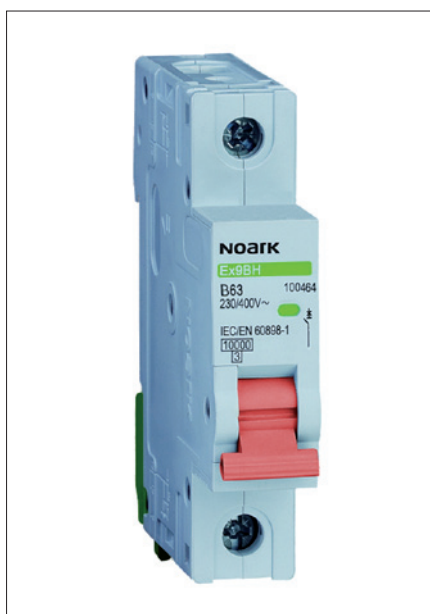
Obr. 2. Instalační jistič