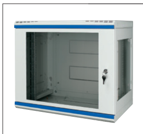
Obr. 3. Nástěnná skříň NWS s odnímatelnými bočnicemi, cylindrickou vložkou a prosklenými dveřmi

Základní charakteristikou nástěnných rozváděčů Standard Line NWS (obr. 3) je větší variabilita provedení. Tyto dvou- i třídílné skříně jsou k dispozici jak s prosklenými, tak