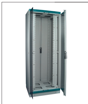
Obr. 4. Stojanový rozváděč NWS

i s plechovými dveřmi. Prostorově lze vybrat z verzí pro 6 až 21 modulů v hloubkách od 400 do 600 mm. Rozváděče řady Standard Line NWS jsou nově k dispozici ve verzi s odnímatelnými bočnicemi. Možnost odejmout bočnici určitě ocení každý technik při zapojování, kontrole a údržbě datového rozváděče.