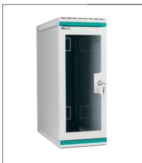
Obr. 5. Věžový rozváděč NTS

i s plechovými dveřmi. Prostorově lze vybrat z verzí pro 6 až 21 modulů v hloubkách od 400 do 600 mm. Rozváděče řady Standard Line NWS jsou nově k dispozici ve verzi s odnímatelnými bočnicemi. Možnost odejmout bočnici určitě ocení každý technik při zapojování, kontrole a údržbě datového rozváděče.