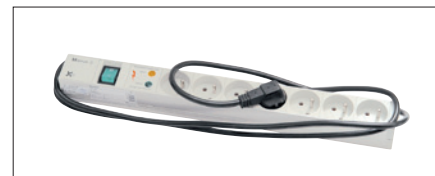
Obr. 6. Napájecí panel se svodiči přepětí třídy III (D)

Rozváděče Basic Line NCE jsou nabízeny ve výškách pro 23, 33, 37 a 42 modulů s šířkou 600 nebo 800 mm a hloubkou 600 a 800 mm. Lze volit z kovových a prosklených dveří, různých typů dolních a horních krytů, s ventilací nebo bez ní apod. Samozřejmostí je rozmanitě vnitřní příslušenství.