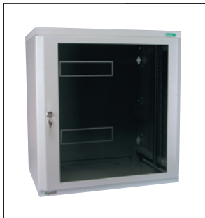
Obr. 2. Devatenáctipalcové nástěnné rozváděče Basic Line NWE

zeny prosklenými dveřmi, u nichž lze snadno měnit směr otevírání. Dveře jsou standardně opatřeny zámkem. Vnitřní vybava se montuje na posuvné lišty.