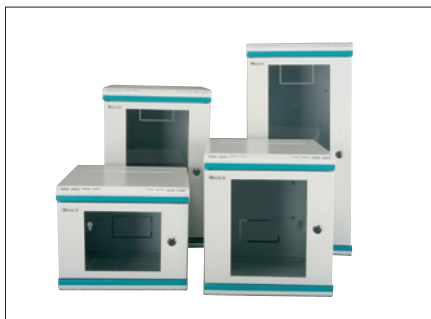
Obr. 1. Desetipalcové nástěnné rozváděče SOHO

Nástěnné rozváděče s šířkou pro 10" panely nesou označení SOHO (obr. 1). Jejich výška je od 4 do 12 modulů U. Skřínky jsou osa-