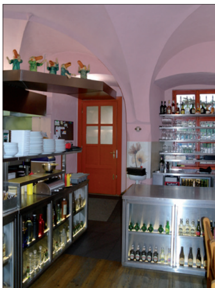
Obr. 5. Osvětlení obslužné místnosti doladujících prosvětlených vitrín (restaurace)

„Když jsme z bývalého průjezdu začali stavět restauraci, přesně jsme věděli, jak bude vypadat kuchyně, přípravná i ostatní prostory, ale nevěděli jsme, jak v tomto velice zajímavém prostoru vyřešit osvětlení. Chtěli jsme osvětlení respektující atmosféru Malé Strany, hosty, interiér, včetně uměleckých instalací, a zároveň jsme potřebovali vyhovět normám