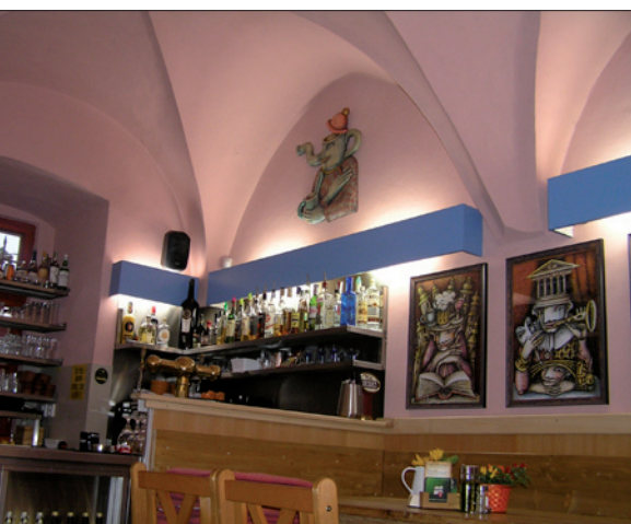
Obr. 1. Zářivková svítidla umístěná v otevřených truhlících v obslužné místnosti, která je z jedné třetiny i prostorem hostinským, směrem nahoru osvětlují krásnou gotickou klenbu, směrem dolů svítí hostům, barmanovi i na pracovní plochu kuchaře (restaurace)

„Světlo je jedním z neefektivnějších nástrojů vytváření správné nálady v prostorách určených pro různé odpočinkové činnosti. Každý majitel restauračního zařízení se snaží přilákat hosty do své restaurace či k posezení u baru. Zákazník hned při vstupu do zařízení zhodnotí prostor a rozhodne se, zda zůstane. Osvětlení by mělo spoluvytvářet požadovanou image prostoru. Světlem lze dotvořit styl tohoto zařízení, upozornit na architektonické zvláštnosti jako např. vzhled historických kleneb či výzdobu povrchů, zvýraznit významná místa – recepci, výčep, vytvořit intimitu prostředí či prostor naplnit světlem a tpytem...“