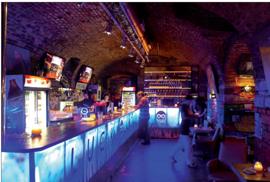
Obr. 9. Dominantní hlavní bar prosvětlený chladně bílým světlem zářivek shora přisvětlují světlomety a LED pásky na policích