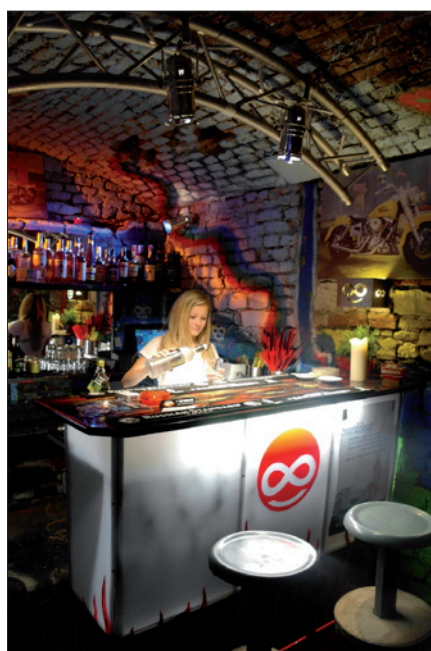
11. Boční bar – kvalitním osvětlením ocení hlavně barmani při své práci

Veškeré malby, témata a vzory vymalovalo pod symbolickým dozorem majitelů nezávisle na sobě patnáct mladých výtvarníků. Cílem bylo vytvořit zajímavý prostor, který by jak provozovatelům, tak i návštěvníkům dokázal udělat život lepší, veselější, šťastnější. S touto ideou jsme tedy začali přetvářet vcelku ponurý sklep na místo, ze kterého na první pohled sálá pozitivní energie. Atmosféru do-