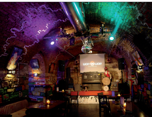
Obr. 10. Malý sál kavárenského stylu určený převážně pro produkci diskžokejů je vybaven scénickými svítidly; trvalé osvětlení zajišťují nástěnná svítidla se světlem teple bílé barvy (klub)

ných policích nerezových vitrín. Paprsky z LED dopadající na stěny vitrín vytvářejí proužky světla perspektivně ubíhající do strany a zajímavě prosvětlují vystavené láhve. Prosvětlené vitríny tak doladují osvětlení celé místnosti.