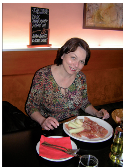
Obr. 3. Díky kvalitnímu osvětlení hosté dobře vidí i na to, co mají na talíři

lík s fotografem Radkem Tomasem, majitelé klubu Art/Music club Lucky Lucky , se při řešení osvětlení obrátili právě na tuto společnost. Jejich cílem bylo vytvořit co nejpříjemnější prostředí, kde by se hosté i personál cítili skutečně dobře. Stěny zdobí výtvarná díla majitelů a jejich přátel a spolu s kvalitním osvětlením vytvářejí tu správnou atmosféru s ohledem na cha-