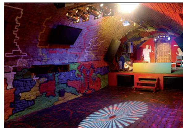
Obr. 8. Inteligentní světlomety vytvářejí barevnou gobu na podlaze (klub)

Celá místnost je vymalována oranžovou a vínovou barvou a stěny v pracovních prostorech jsou obloženy ple-