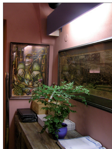
Obr. 4. Pod zářivkovým světlem se daří i živým rostlinám (restaurace)