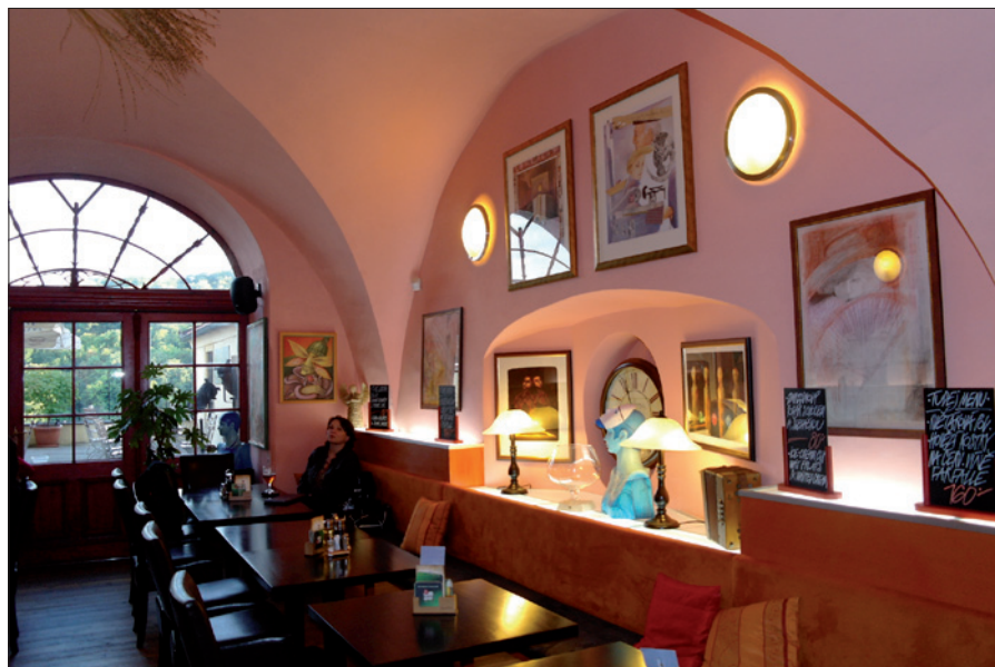
Obr. 2. Prosvětlená opěradla lavic chladně bílým světlem v kombinaci s nástěnnými a stolními svítilny se světlem teple bílé barvy navozují intimní atmosféru (restaurace)

Tak začíná článek Ing. Jany Lepší ze ŽÚ se sídlem v Plzni, Servírka, číšník, barman, kuchař ve světle NV 361/2007 (změna 68/2010 Sb.) , věnovaný požadavkům na osvětlení v restauracích, barech apod., který vyšel v časopise Světlo 3/2011, str. 55 až 60. Vzhledem ke všem požadavkům uvedeným ve zmíněném článku by bylo ideální, kdyby si majitelé zmíněných za-