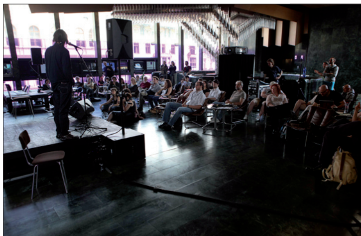
Obr. 4. Sound Kitchen, prezentace zvukových projektů v horním foyer Nové scény

lů, což jen dokazuje, že světelný design je mezioborová disciplína. Na rozdíl od dalších mluvčích se F. Rossova specializuje téměř výhradně na divadlo (všech žánrů), kde se iluzivnost odrazů dokáže prosadit nejlépe.