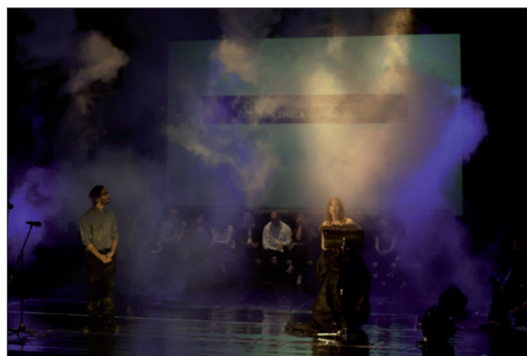
Obr. 5. Okamžik před předáním hlavní Ceny PQ Zlatá triga

Zvuková kuchyně byla v provozu každý den od 10 do 12 a od 14 do 16 hodin v horním foyer Nové scény. Tento osobitý prostor, jemuž dominuje světelná plastika procházející všemi patry, tmavý kubánský mramor a prosklená stěna na Národní třídě, se vskutku zvláštní akustikou se podle prezentovaných zvukových projektů proměňoval v „chillout“, etnoscénu nebo industriální minimal „ambient space“. Na 27 sólových i skupinových „koncertů pro mobil-