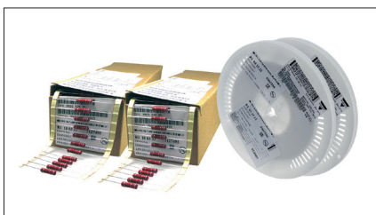
Obr. 2. Elektronické součástky zabalené pro osazovací automat

U společnosti Distrelec lze obdržet i součástky ve větším odborném zboží pro osazovací automaty (obr. 2). Zboží je k dostání v balení ammpack, popř. na rolích (sedmipalcové role) – vše bez příplatku. Příslušná nabídka vybraných součástek je průběžně rozšiřována. V informačních médiích Distrelec (katalog, on-line shop) je toto zboží odpovídajícím způsobem označeno a lze je snadno vyhledat.