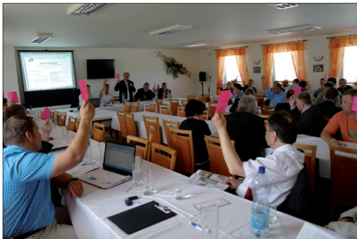
Obr. 3. Stěžejním bodem valné hromady bylo schválení členů předsednictva kooptovaných předsednictvem