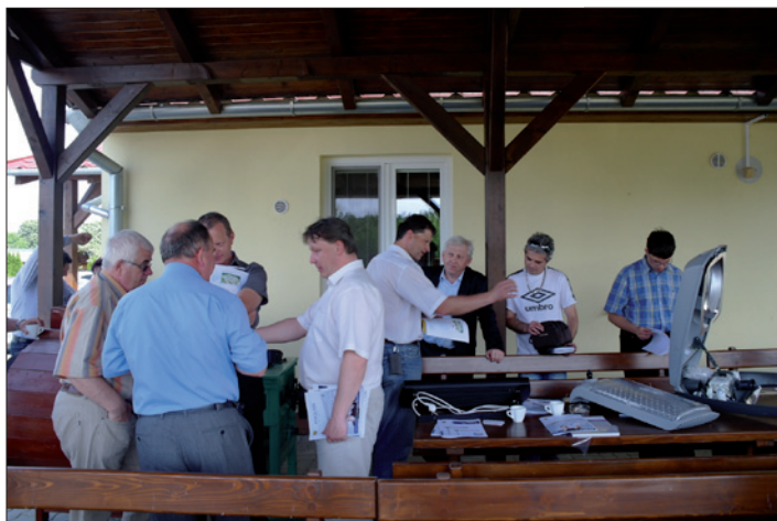
Obr. 5. Vzhledem k hezkému počasí mohla být výstavka materiálů a komponent světelné techniky umístěna venku