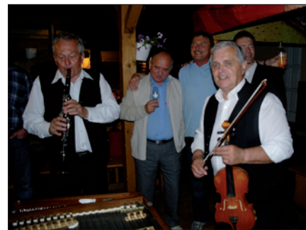
Obr. 6. Neformální část valné hromady pokračovala za doprovodu cimbálové muziky do pozdních nočních hodin

Za zdárný průběh slavnostní valné hromady ke kulatému výročí SRVO patří díky všem sponzorům a zejména organizačnímu garantovi a generálnímu sponzorovi, společnosti Vysto Kobylí s. r. o. Při příležitosti této akce byl vydán pamětní list s logy firem, které přispěly k důstojné oslavě dvacátého výročí společnosti.