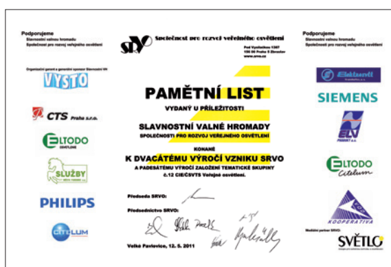
Obr. 2. Pamětní list vydaný k dvacátému výročí SRVO