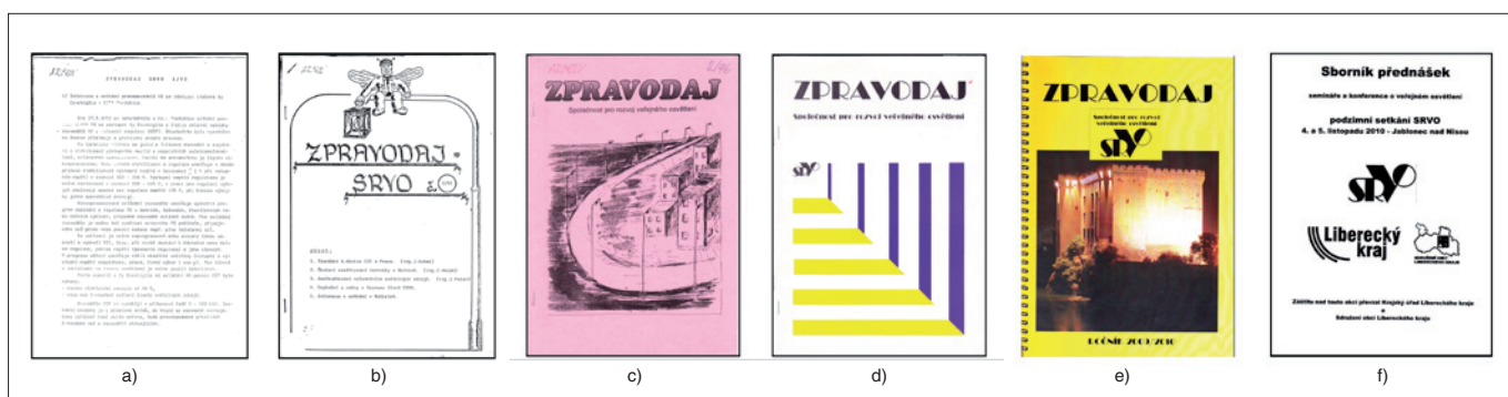
Obr. 1. Zpravodaj SRVO - jak šel čas...

rence cíleně zaměřené na určitou skupinu zájemců, jako např. školení pro projektanty nebo tematické konferenze pro zástupce státní správy) a podílela se i na dalších akcích z oboru. Následoval příspěvek o tom, že světlo a osvět-