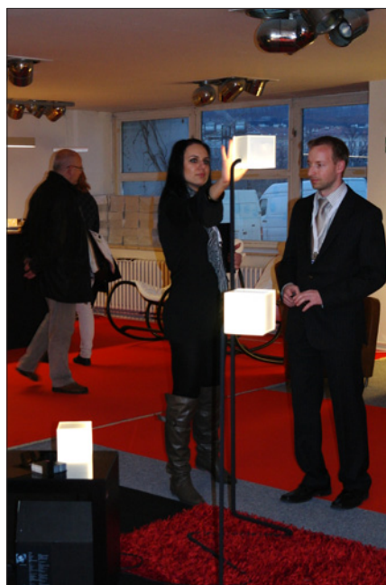
Obr. 3. Prezentace svítidla – světelné kostky se zabudovaným senzorickým systémem, který detekuje pohyby ruky (reaguje bez fyzického kontaktu se svítidlem), v expozici slovenské společnosti Neco

odborné veřejnosti – architektům, projektantům, světelným technikům, stavebním inženýrům a developerům z České republiky i zahraničí. Akci organizovala společnost Czech Architecture Week, pořadatel každoročního festivalu moderní a současné architektury Architecture Week v Praze a Ostravě ( www.architectureweek.cz ).