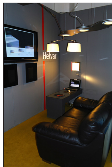
Obr. 5. Prezentace řídicího systému Helvar v expozici společnosti DNA

Menší prostor po pravé straně hlavního vstupu do budovy byl vyčleněn sekci věnované osvětlení kanceláří . Organizátoři výstavy plánují zaměřit se na tuto problematiku více v příštím ročníku.