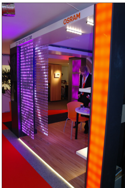
Obr. 2. Expozice Osram – prezentace světelných možností LED