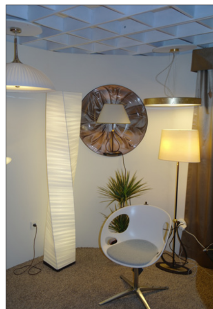
Obr. 4. Různé typy svítidel v expozici českého výrobce, společnosti Ezr