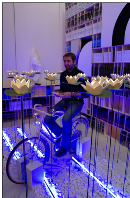
Obr. 9. Osvětlení na lidský pohon v expozici Viabizzuno