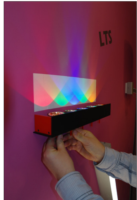
Obr. 10. Speciální svítidlo pro architekturní osvětlení v nabídce Profi lighting

dukty a tři čestná uznání, které byly předá- ny první den výstavy v rámci slavnostního večera pro vystavovatele, konaném v mo- delovém bytě a přidružených prostorách (podrobnosti o soutěži najdete na str. 34).