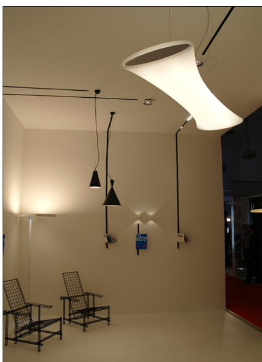
Obr. 1. Závěsné svítidlo Nebel, design Paul Ameloot, výroba Delta Light, bylo dominantou expozice Delta Light Czech (cena časopisu Světlo)

Stejně jako v loňském roce vybírala odborná komise exponáty k hodnocení ze všech vystavených svítidel podle jejich novosti, nápaditosti a přínosu k řešení problematiky osvětlení. Vybrané exponáty byly následně hodnoceny podle pěti kritérií. Protože jde o výstavu ryze oborovou, zastoupenou známými značkami zahraniční i české produkce, je nabídka kvalitních exponátů na této výstavě na české poměry velmi široká. Proto se komise tak jako vloni rozhodla zaměřit pouze na ty z nich, které dosud cenu v žádné jiné soutěži neobdržely. Komise si prohlédla nejzajímavější exponáty, vyžádala si od vystavovatelů podrobný výklad a dokumentaci. Výsledkem byla nominace čtrnácti exponátů pro další hodnocení.