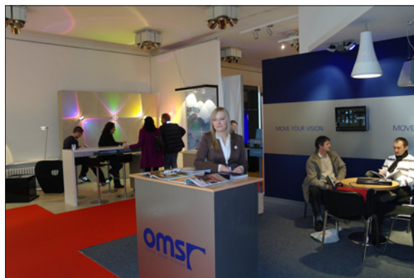
Obr. 7. Modrošedá expozice slovenského výrobce svítidel OMS (vpravo) v kontrastu s expozicí společnosti Williams Galerie světla – Occhio Store Praha, každý den trochu jinak barevně vyzdobenou díky světelným možnostem speciálního světlo- metu pro architekturní osvětlení