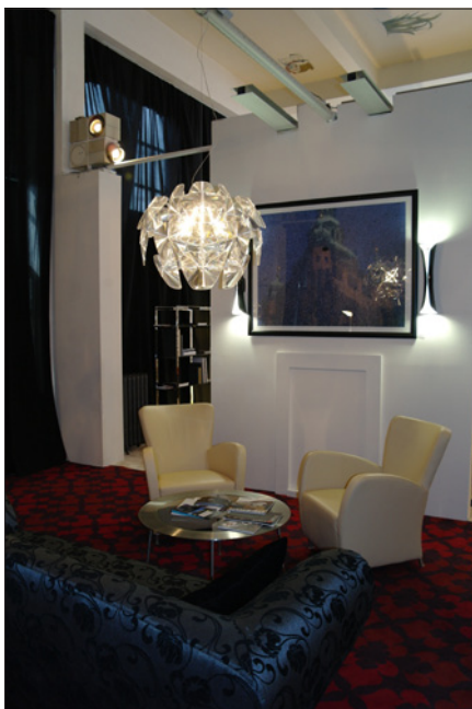
Obr. 12. Osvětlení obývacího pokoje – ukázkový modelový byt

odložili až na poslední chvíli. Zastoupeny byly společnosti z oboru svítidla a osvětlení (většina), společnosti zabývající se designem nábytku, vybavením interiérů a několik středních a vysokých odbor-