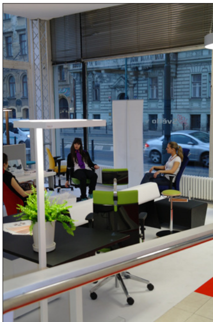
Obr. 13. Menší prostor po pravé straně hlavního vstupu do budovy byl vyčleněn sekci věnované osvětlení kanceláří

ných škol. Při vědomí, že tato výstava je koncepčně řešena jako malá specializovaná akce určená především odborníkům, jde o velmi slušné zastoupení. Nelze se