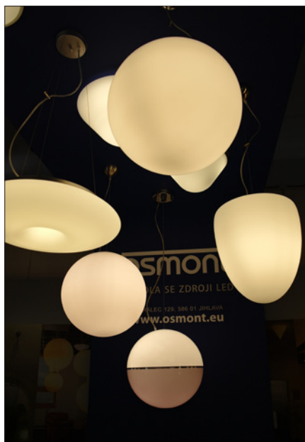
Obr. 8. Eleganční svítidla českého výrobce Osmont – v nabídce ve verzi s tradičními svě- telnými zdroji i s LED zdroji

ze společnosti Delta Light Czech, kte- rý v souladu s aktuálními platnými nor- mami a předpisy odborně zpracoval a finančně se podílel na realizaci jeho osvětlení, byl tento byt vybaven svíti-