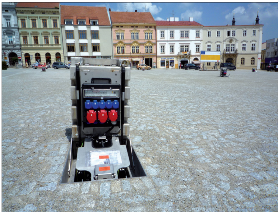
Obr. 1. Podzemní rozvaděč LIC – realizace Znojmo, Horní náměstí – příprava na akci

Elektrické rozvaděče jsou vyrobeny z pryže, vždy podle individuálních požadavků zákazníka. Nejčastěji obsahují jednofázové a třífázové zásuvky (do velikosti 63 A), ale je možné do nich zabudovat i zásuvky na 24 V, datové zásuvky či elektroměr. Není-li plocha k instala-