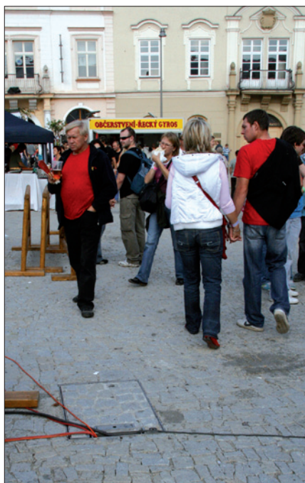
Obr. 2. Podzemní rozvaděč LIC – realizace Znojmo, Horní náměstí – v provozu

Jejich další předností je možnost vybavit je kohouty pro připojení pitné vody i přípojkou pro odtok odpadní vody (napojení na kanalizaci). Takto vybavené rozvaděče fungují jako tzv. energocentra.