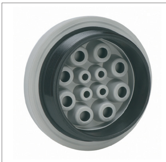
Obr. 3. Zadní strana průchodky KEL-DPZ se závitem M50

Další informace o produktech firmy icotek GmbH, stejně jako o výrobcích dalších firem, které na našem trhu zastupuje společnost OS-KOM spol. s r. o., lze získat na www.oskom.cz