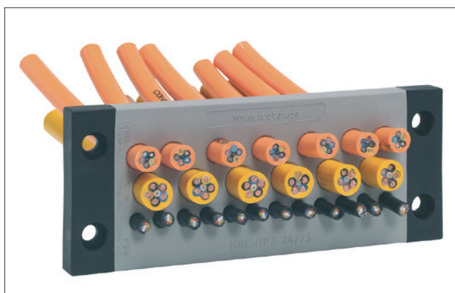
Obr. 2. Obdélníková průchodka KEL-DPZ

Toto provedení umožňuje použít kabely s průměrem až 22 mm, upevnění je lepší a krytí vyhovuje třídě IP65. Montáž na zařízení se díky pevnému rámečku provádí u obdélníkových provedení šrouby, u kulatých maticí s metrickým závitem M32 až M63 (obr. 3).