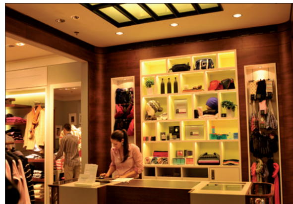
Obr. 7. Prostor pokladny

Všechna svítidla jsou zapuštěná a lícuje se stropem, bez přesahu, bez rámečku. Mají největší možný úhel clonění a jsou vybavena „darklight“ reflektory pro zajištění klidného stropu, který není narušen ani vystupujícími částmi svítidel při nasměrování bodových svítidel. Kromě vizuálního komfortu však světelný koncept a použité techniky velmi významně ovlivňují také energetickou efektivitu. Ze strany investora byl tento aspekt významně posuzován i s ohledem na návratnost investice. Z kalkulací vyplývají tyto závěry. Vyšší investice do kvalitního a efektivního osvětlení je velmi rychle kompenzována redukcí nutného příkonu a spotřeby energie (v tomto případě téměř o 30 %), a to jak pro osvětlení, tak pro klimatizaci. Navíc v době pořízení je vyšší investice do světla ihned srovnána nižší investicí do klimatizace snížením tepelné zátěže. A toho všeho je dosaženo tak, že v popředí stojí zboží, značka a koncept prodejny.