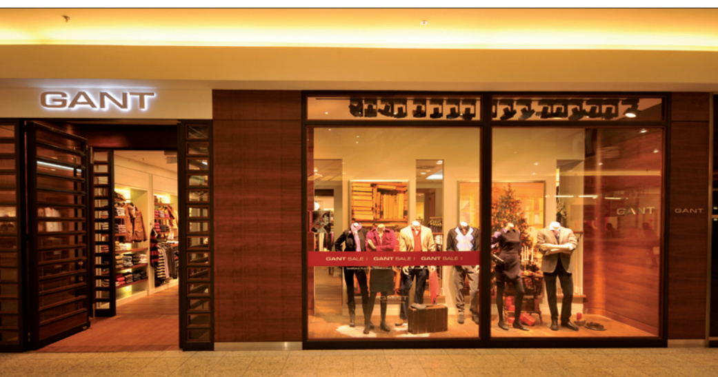
Obr. 1. Výloha v celku

Architektonický návrh prodejny počítá s uskočenými stropy v každé dílčí části obchodu, které jsou podsvíceny LED pásy se studeným bílým světlem pro podtržení „vodní“ značky GANT. Proto bylo zvoleno uspořádání svítidel formou zapuštěných slícovaných stropních svítidel typu směrovatelných bodových svítidel (directional) a svítidel k osvětlení svislých ploch (wallwasherů). Designová řada ERCO Quintessence obsahuje tyto rozdílné světelné techniky a detaily osazení. Vždy podle typu prodejny byl navržen modulový koncept, který se skládá z „wallwasheru“, směrovatelného bodového svítidla (spotu) a pří-