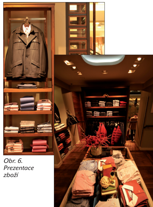
Obr. 6. Prezentace zboží