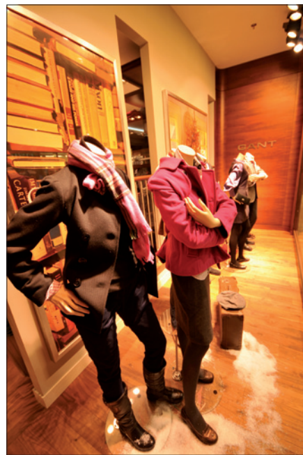
Obr. 2. Výloha se zdůrazněním stěn a typických prvků GANT

Po vstupu do prodejny je podstatné to, aby se zde zákazník cítil dobře, pohodlně si vybral a vyzkoušel zboží ve správném světle a nakoupil. Proto byl rozdělen prostor prodejny na tyto části: