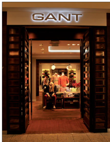
Obr. 5. „Wallwashing“ na stěnách a hloubka prostoru

a „downlightu“ v jednom svítidle. V této „veřejné“ části je tak příjemně prosvětlen celý prostor i se stěnami. Na rozdíl od „privátní a intimní“ zóny vlastní zkušební kabiny, kde světlo zajišťuje vždy jeden „washlight“ pro zamezení oslnění v zrcadle a dvě směrovatelná bodová svítidla s IR filtrem a přidavným cloněním nad zrcadlem nasměrovaná na postavu stojící před zrcadlem.