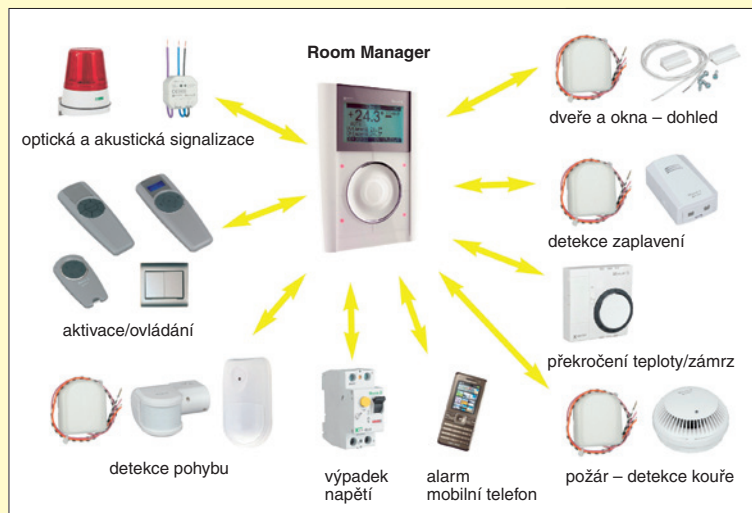
Obr. 3. Room Manager rovněž plní bezpečnostní funkce