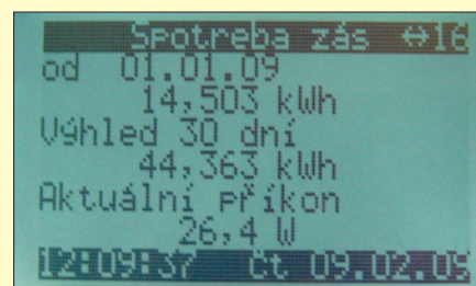
Obr. 5. Zobrazení elektrických veličin

Room Manager lze využít ke sledování aktuální spotřeby elektrické energie, plynu nebo vody za požadované období (den, týden, měsíc, rok) a podle aktuální spotřeby předpovídat spotřebu do budoucna (měsíc, rok). Spotřebu energie za požadované období v kilowatttech, metrech krychlových či korunách lze sledovat na displeji jako hodnotu nebo ve sloupcovém diagramu (den, týden,