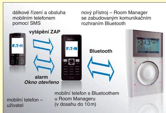
Obr. 2. Mobilní telefon pro vzdálenou komunikaci

Každý dům a byt je nutné vytápět. RM zajišťuje zónovou regulaci vytápění/chlazení až pro šest místností. Místnosti mohou být vytápěny na různé teploty v průběhu dne zcela in-