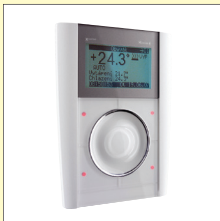
Obr. 1. Řídicí jednotka pro zónovou regulaci až šesti místností

(teploty, vlhkost, intenzita, spotřeba energií), popř. venkovní teplota s aktuálním trendem vývoje oteplení. Zobrazovány jsou rovněž stavy ovládaných výstupů, které je možné dotykovým kolečkem i ovládat. Čtyři dotykové senzory lze využít např. k aktivaci světelných scén, přepnutí topného režimu nebo ke změně teploty v místnosti, vyvolání simulace přítomnosti či k ovládání rolet. Výběr funkcí je velmi pohodlný – jsou voleny z nabídkového menu s uživatelskými a servisními obrazovkami, na kterých lze mj. sledovat i stav baterií připojených senzorů.