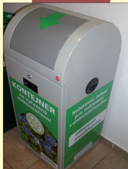
Obr. 3. Vzor sběrného kontejneru RETELA

Vzor sběrného kontejneru RETELA na drobné elektrospotřebiče mimo zářivky.