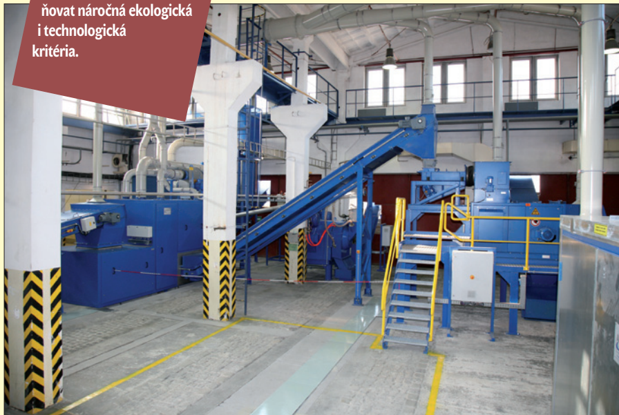
Obr. 4. Zpracovatelská linka

Linky na zpracování elektroodpadu musí splňovat náročná ekologická i technologická kritéria.