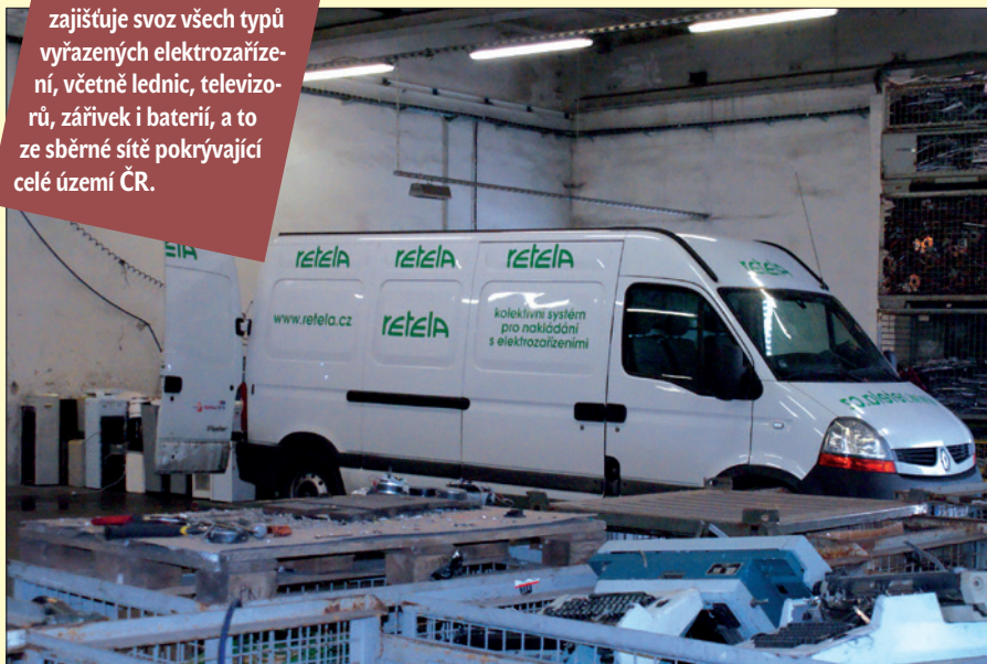
Obr. 1. Svoz a shromaždiště EEZ s autem s logem RETELA

RETELA zajišťuje svoz všech typů vyřazených elektrozařízení, včetně lednic, televizorů, zářivek i baterií, a to ze sběrné sítě pokrývající celé území ČR.