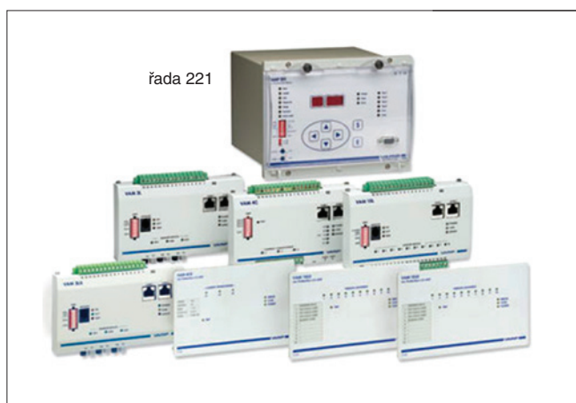
Obr. 3. Do portfolia nabídky patří taktéž zábleskové ochrany řady 120, 121 a 221

V případě zájmu lze kontaktovat společnost na: Jízdárenská 227, 664 62 Hrušovany u Brna tel.: +420 547 236 270, mobil: +420 776 113 808 e-mail: pbackar@el-insta.cz http://www.el-insta.cz http://www.vamp.fi