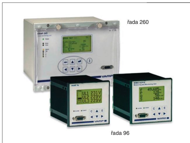
Obr. 2. Multifunkční měřicí přístroje řady 260 a 96