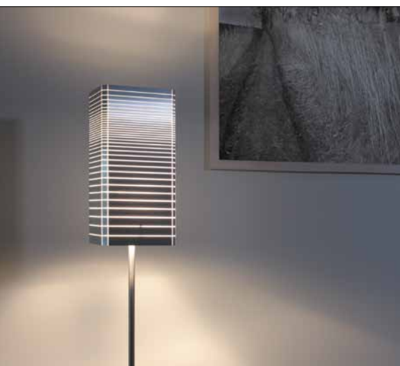
Obr. 1. Stojanové svítidlo Lampoo

Kolekce navržená ateliérem Boa design je souborem závěsných, stolních a stojanových svítidel, která vycházejí