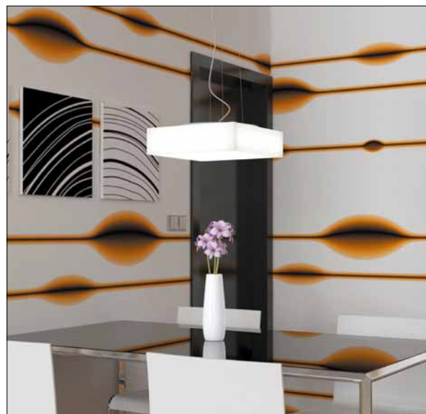
Obr. 7. Závěsné svítidlo Cube