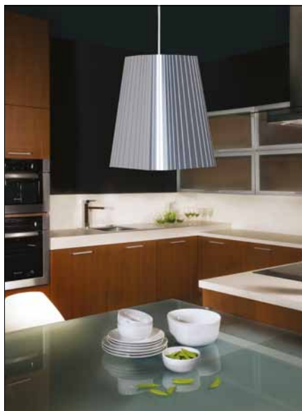
Obr. 2. Závěsné svítidlo Tria

z čistých geometrických tvarů. Jednotícím prvkem je netradiční materiál, který dodává celé kolekci specifický ráz. Jde o dva kovové pláty spojené k sobě vrstvou polymeru. Díky kombinaci tenkých vrstev kovu a plastu má tento materiál unikátní vlastnosti, zachovává si charakter kovu,