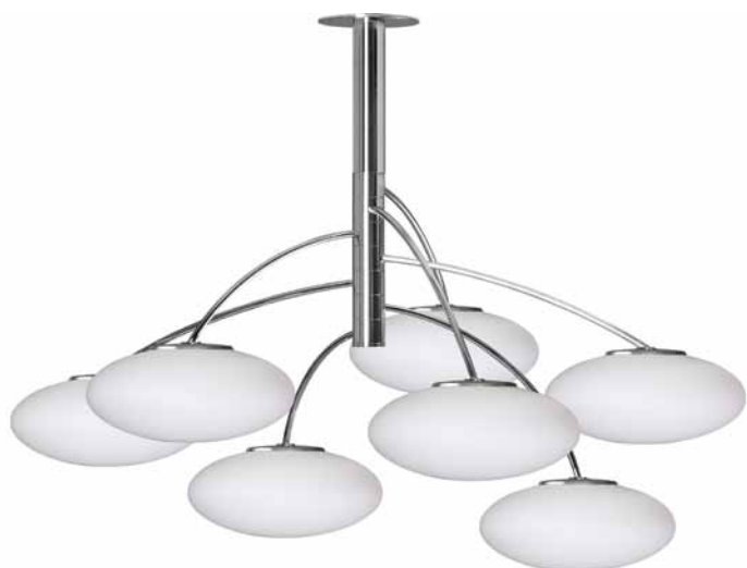
Obr. 5. Závěsné svítidlo Karme