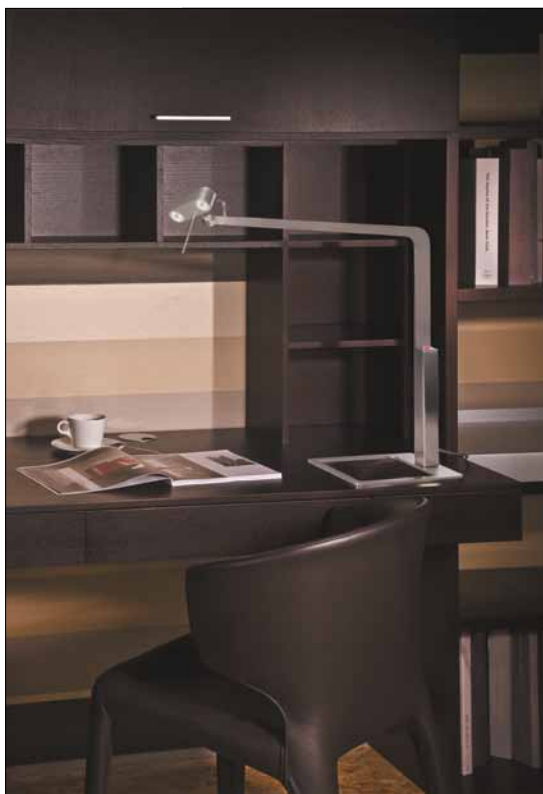
Obr. 3. Stolní svítidlo Verso

ale přitom je až překvapivě lehký. Oboustranným profrézováním vrchních kovových plátů vznikl na povrchu unikátní dekor. Vyfrézované linie propouštějí světlo, a vytvářejí tak působivý efekt. Rozdělením plochy na menší segmenty se světlo na povrchu láme a vytváří působivé od-