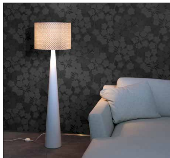
Obr. 8. Stojanové svítidlo Tinto

řadu stropních a závěsných svítidel a stojanového svítidla. Nový design stropního a závěsného svítidla rozšiřuje variabilitu při realizaci osvětlení pro zákazníka. Stavebnicový systém závěsu nabízí různé možnosti rozložení jednotlivých ramen, a tím i využití potenciálu závěsného svítidla ve velkých prostorách.