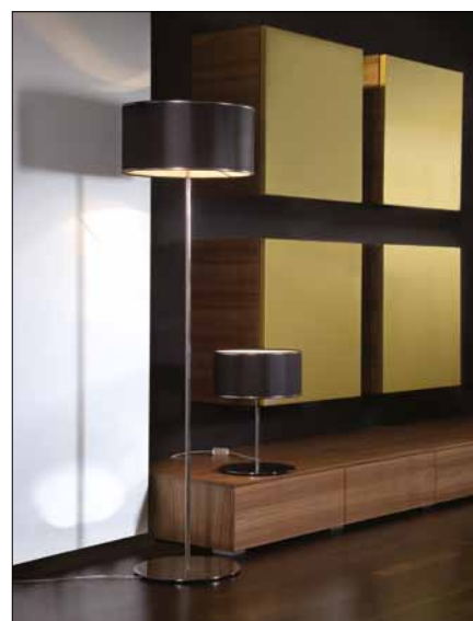
Obr. 9. Stojanové svítidlo Vox