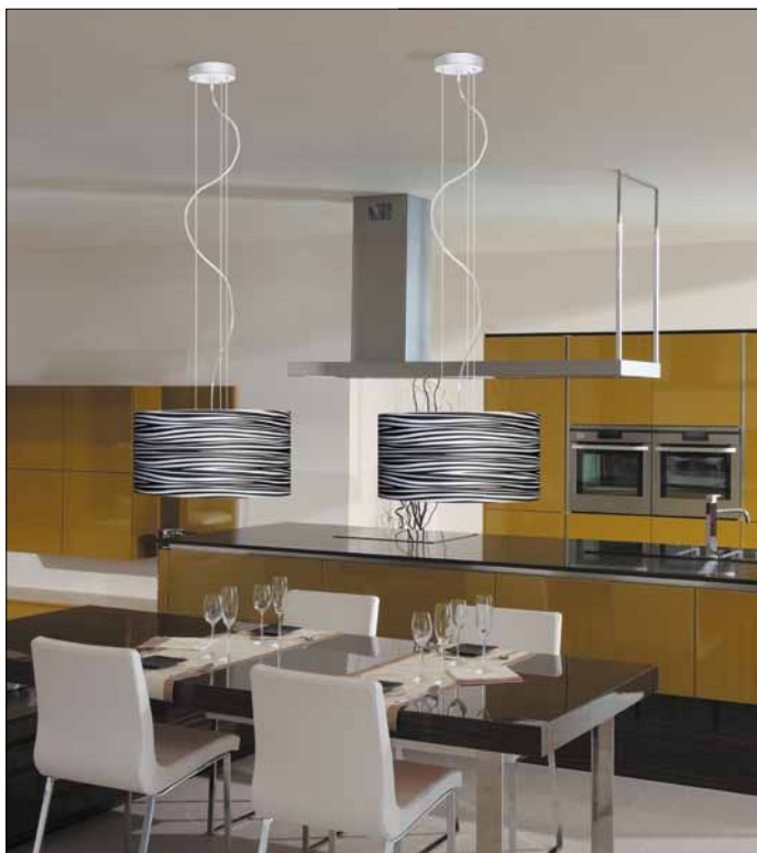
Obr. 10. Závěsné svítidlo Brava

Mezi novinky patří další řady svítidel: Tinto, Brava a Vox. Tyto kolekce vznikly na základě požadavků zákazníků na rozšíření sortimentu Via Lucis se stínidly z klasických bavlněných materiálů (pod obchodními názvy Perlatex a Chintz) s využitím dosavadních materiálů a nosných prvků svítidel; u řady Tinto jde o lamináty, u řady Vox o koroziuvzdornou ocel a u řady Brava o lakovanou ocel. Stínítka svítidel Brava a Tinto jsou oživena originálním dekorativním potiskem.