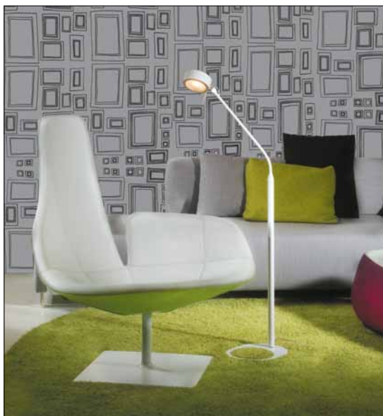
Obr. 4. Stojanové svítidlo Omnia

Omnia je stolní svítidlo využívající podobný funkční koncept jako Verso. Má však jednodušší tvarosloví, které vychází ze základních geometrických prvků, a zcela odlišný zdroj. Za zdroj světla je zde zvolena halogenová žárovka. Kromě stolní verze má svítidlo i variantu stojan-