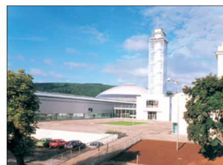
Obr. 3. Vyhlídková věž pavilonu G je dominantou Výstaviště již od jeho výstavby v roce 1928

Sudé ročníky brněnského veletrhu zpravidla probíhají ve znamení obrábění a tváření. Mezi přihlášenými je většina tradičních velkých vystavovatelů tohoto oboru a představí se i firmy, které loňský rok