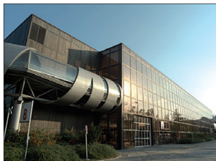
Obr. 2. V pavilonu B se budou tradičně prezentovat firmy z oboru pohonů

Zajímavý exponát avizuje Ústav jaderného výzkumu Řež: v Brně vystaví autobus na vodíkový pohon, který vzbudil velkou pozornost na letošním veletrhu v Hannoveru.