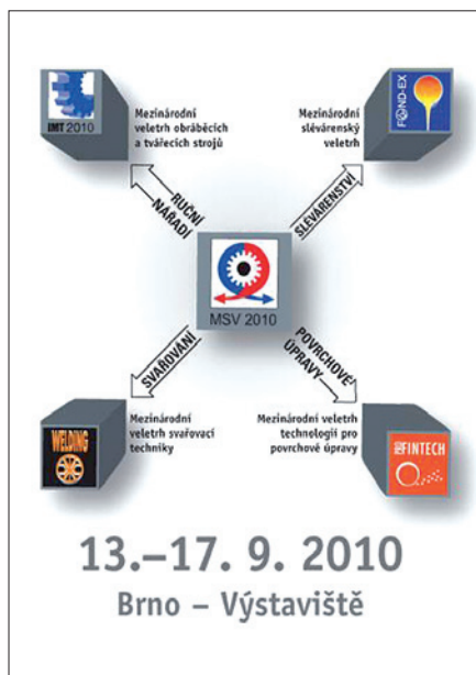
Obr. 1. Struktura letošních doprovodných veletrhů při MSV v Brně

Počet přihlášených vystavovatelů na letošním 52. MSV v Brně dává za pravdu očekávání pořadatelů, že expozicemi budou zaplněny všechny pavilony, včetně největšího nového