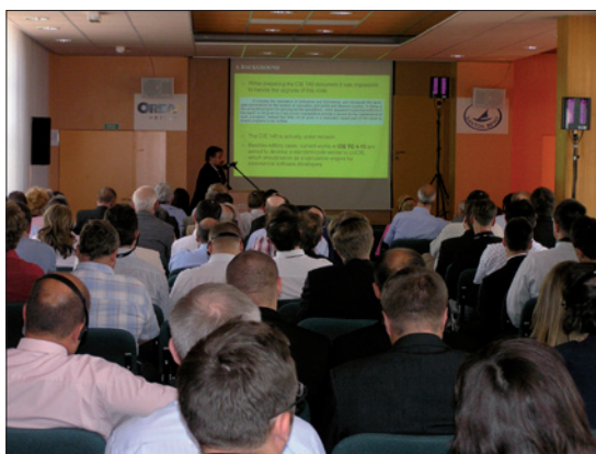
Obr. 5. Účastníci konference pozorně sledují jednu z přednášek o veřejném osvětlení