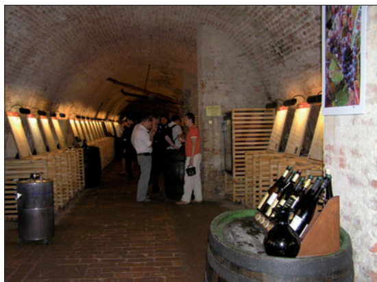
Obr. 6. První večer patřil degustaci výběrových vín ve sklepních prostorách valtického zámku

Vedle odborné části měla konference i velmi kvalitně připravený doprovodný program. První večer patřil návštěvě Salónu vín České republiky ve sklepních prostorech valtického zámku, bývalého sídla Lichtenštejnů ve Valticích. Degustační nabídka byla opravdu kvalitní. Ve zdejší