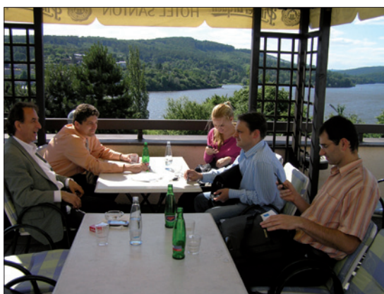
Obr. 4. Zástupci společnosti ELKOV elektro a GE při diskusi na terase u kongresového sálu