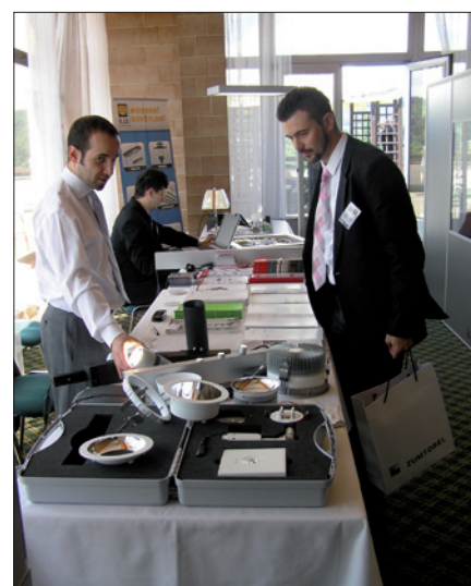
Obr. 10. Firemní prezentace pokračovaly i v zadní části kongresového sálu