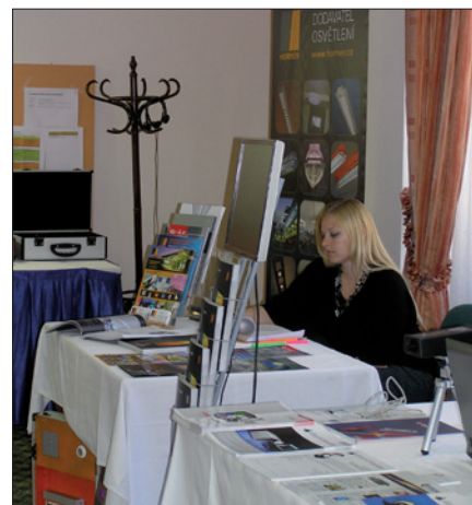
Obr. 9. Jedna z firemních prezentací v předšálí

Na závěr patří poděkování všem, kteří usilovně, po řadu měsíců, pracovali