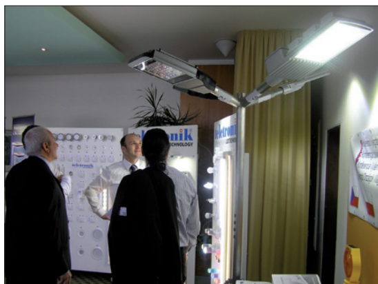
Obr. 7. Presentace LED svítidla pro veřejné osvětlení v předšálí

expozici je umístěno 100 nejlepších vín ČR 2010. Protože k dobrému vínu patří i dobré jídlo, byl pro účastníky akce připraven v přilehlých prostorech také bohatý raut. K příjemné atmosféře nemalou měrou přispěla i cimbálová muzika. Druhý den se uskutečnil výlet lodí z námořní flotily města Brna po Brněnské přehradě se zastávkou u státního zámku Veveří a jeho prohlídkou. Opět zde nechybělo kvalitní občerstvení a živá folklórní muzika.