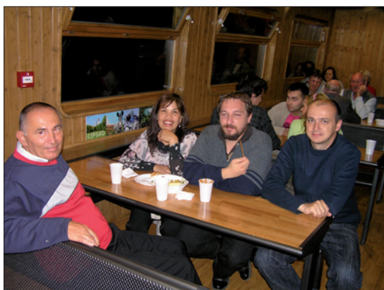
Obr. 8. Hlavní představitelé slovenské delegace při společenském večeru na lodi

Při ohlédnutí zpět je možné konstatovat, že III. ročník konference LUMEN V4 měl vysokou odbornou úroveň, splnil vytčený cíl a bude významně ovlivňovat mnoho našich činností nejen v oblasti projektování, ale i v provozu a údržbě osvětlovacích soustav v energeticky úsporných systémech. Světelná a osvětlovací technika budou zlepšovat pozitivní účinek světla