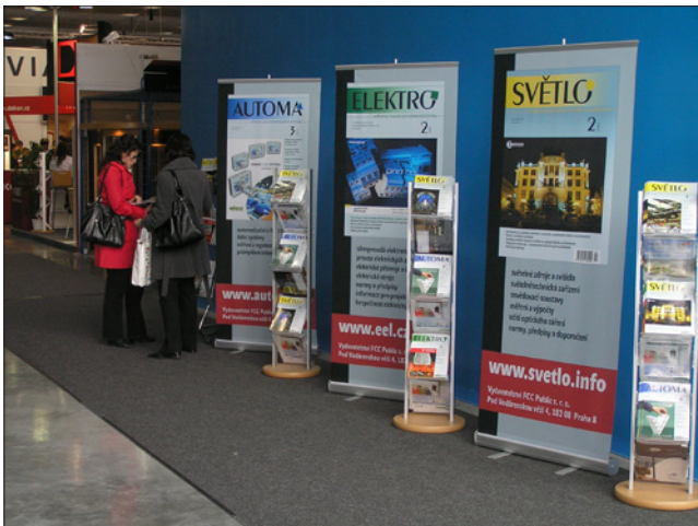
Obr. 2. Časopisy odborného vydavatelství FCC Public našli zájemci na tradičním místě u vstupu do pavilonu F

přehledka montovaných, kompletně vybavených rodinných domů, vzorkovna stavebních materiálů a poradenské středisko pro otázky bydlení a výstavby včetně finančního zajištění) o obory související s bydlením a interiéry přidružením veletrhu Mobitex (mezinárodní veletrh nábytku a interiérového vybavení) vznikl ucelený komplex veletrhů, který zahrnuje všechny obory staveb-