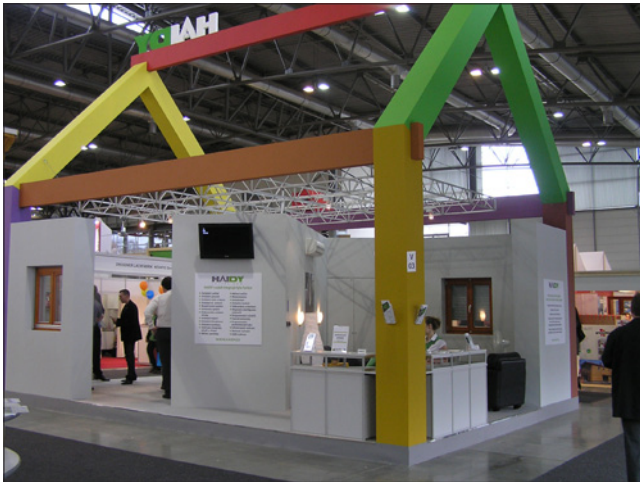
Obr. 5. Prezentace ovládání chytrého domu HAIDY od české společnosti Positro a. s., který získal jednu ze Zlatých medailí SHK 2010