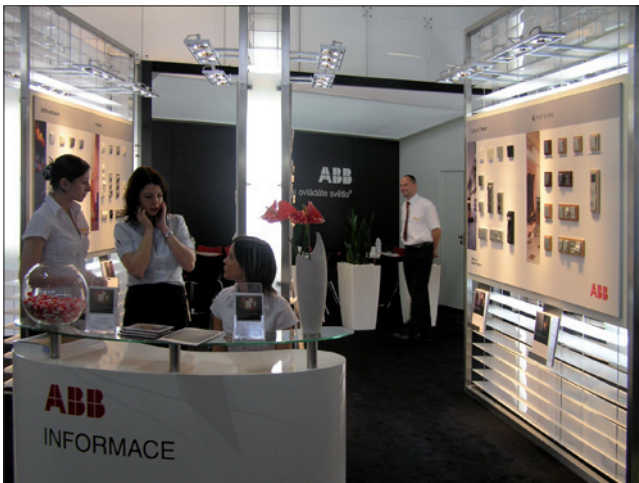
Obr. 1. Z nabídky tradičního vystavovatele, společnosti ABB (detail expozice)

ními zdroji a spotřebiči nebo spotřebiteli). Energetická efektivita byla rovněž řešena v rámci akcí Česko-německé průmyslové a obchodní komory (ČNOPK). Samostatnou kapitolou tvořilo získávání energií pomocí tepelných čerpadel a solárních systémů, aktuální programy Zelená úsporám (Pozn.: Program Ministerstva životního prostředí ČR spravovaný Státním fondem životního prostředí ČR, jehož cílem je zajistit realizaci opatření vedoucích k úsporám energie a využití obnovitelných zdro-