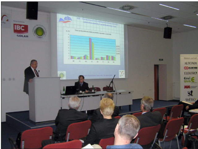
Obr. 6. Z přednášky konference Energie pro budoucnost, pořádané vydavatelstvím FCC Public spolu s BVV a ELA