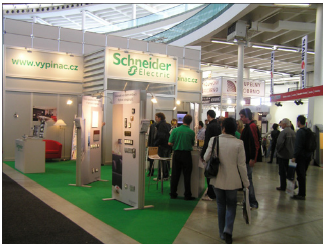
Obr. 7. Výpravná expozice společnosti Schneider-Electric

jů energie v rodinných a bytových domech. V rámci programu lze podporovat pouze akce realizované na území České republiky a ukončené po jeho vyhlášení.) a Nový panel (Pozn.: Program na podporu oprav a modernizací bytových domů. Cílem pro-