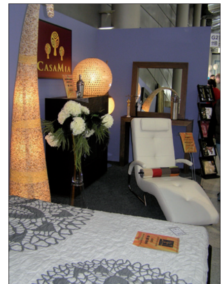
Obr. 4. Světelné objekty v expozici společnosti Casamia (veletrh Mobitex)