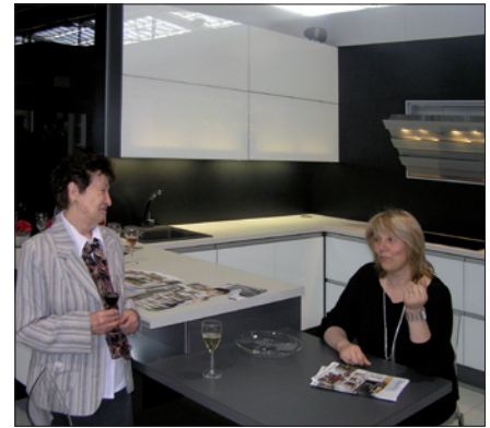
Obr. 9. Vzorově osvětlená kuchyň v expozici českého výrobce nábytku, společnosti Nadop (veletrh Mobitex)

Pro úplnost na závěr předkládáme alespoň několik základních statistických údajů. Na čisté výstavní ploše 37 930 m 2 se v rámci Stavebních veletrhů Brno představilo 1 051 firem z osmnácti zemí světa. Branami prošlo 80 541 návštěvníků ze 36 zemí. Z veletržního průzkumu vyplynulo, že s návštěvou veletrhu bylo spokojeno 81 % návštěvníků a s počtem vystavených produktů a služeb 78 %. Celkem 73 % návštěvníků vyjádřilo spokojenost s počtem vystavených novinek. 48 % vystavovatelů bylo spokojeno s počtem navázaných obchodních kontaktů. Příčinou nedostatku nových kontaktů vidí společnost v dopadech ekonomické krize.