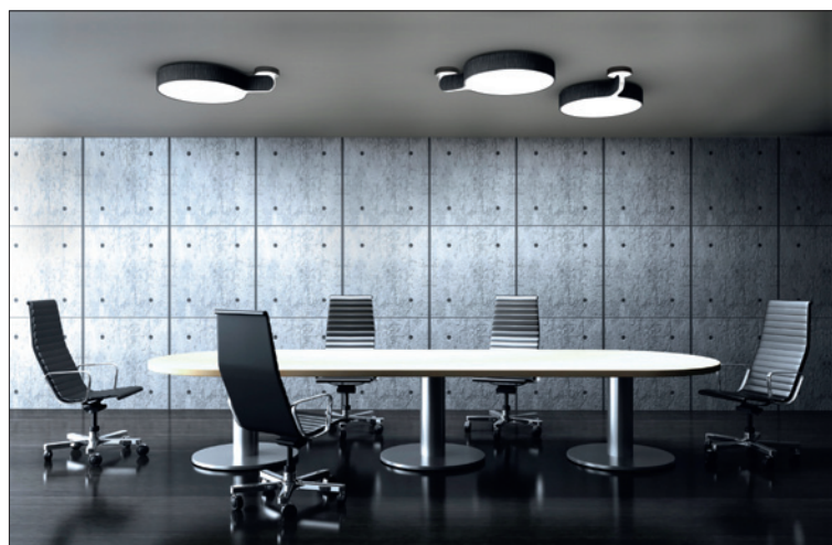
Obr. 4. Moderní kanceláře by měly probouzet kreativitu a poskytovat maximální pohodlí; rozdíl mezi designem bytových a kancelářských svítidel se smazávají; stojanové svítidlo Regent Hello, stropní svítidlo Regent Living

lu. Index podání barev R_a zůstává na hodnotě 94 v celém rozsahu teplot chromatičnosti 2 700 až 6 500 K. Podání barev je konstantní i při stmívání svítidla v rozsahu 20 až 100 %.