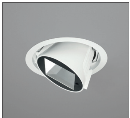
Obr. 1. Svítidlo Poco je díky své konstrukci a světelnětechnickým vlastnostem ideálním k osvětlení obchodních prostor; zařízení PAL mu dodává další přidanou hodnotu

podle aktuální potřeby. Toto zařízení je integrováno do stmívatelného výklopného přímého svítidla typu downlight Poco, jež je osazeno diodami LED (obr. 1); je však možné je osadit i do jiných svítidel.