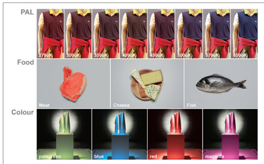
Obr. 3. Díky technice PAL je možné s jediným svítidlem vytvořit patnáct barevných nálad a navíc libovolně regulovat jejich intenzitu; svítidlo vybavené zařízením PAL dokonale nasvítí oděvy, módní doplňky, umělecká díla či potraviny

o tloušťce 1 až 20 mm. Díky těmto přednostem je optimálním produktem k osvětlování butiků a jiných obchodních prostor, kde je možnost osvětlení pružně nastavovat nutností. Technika PAL však tomuto svítidlu dodává další přidanou hodnotu, která spočívá v možnosti nastavit ideální režim a barevnou náladu podle typu prezentovaného zboží (obr. 2 a obr. 3).