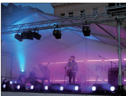
Obr. 3. Hudební produkce v rámci akce Show světél

Jizerský festival světla přítomným názorně ukázal, co dokáže zajímavé a kvalitní architektonické osvětlení udělat s celkem všedními budovami a jak velké možnosti v tomto směru má. Na instalace bylo použito 100 svítidel, jejichž celkový příkon byl 4 607 W.