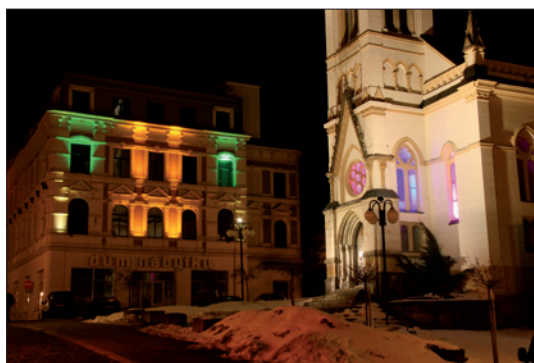
Obr. 2. Osvětlení kostela a fasády domu nábytku

nechalo ujít více než 4 000 lidí. A určitě nelitovali. Program jim mimo jiné nabídl hudební produkci, laserovou show, tanečníky s ohněm nebo možnost vypustit létající přání – ohňový lampion.