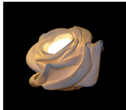
Obr. 14. Růže jako živá – svítidlo z dílny českého výrobce osvětlení, společnosti Lasvit

Výstava se setkala s mimořádně pozitivním ohlasem vystavovatelů i návštěvníků. Ještě v pátek, necelou hodinu před oficiálním ukončením akce, stále přicházeli noví. Ukázalo se, že výstavě přeče jen něco chybělo. Byl to alespoň jeden víkendový den, kdy by si ji i ti,