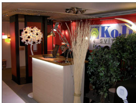
Obr. 11. Expozice české společnosti Koji , zastupující na českém trhu přední rakouské a italské výrobce osvětlení