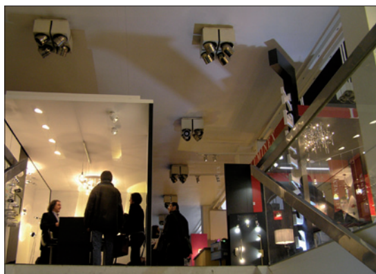
Obr. 7. Pohled do haly A ze spojovacího schodiště vedoucího do haly B – nalevo Williams galerie světla – Occhio store Praha, napravo společnost Luminex