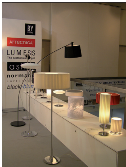
Obr. 6. Rend light studio zastupovalo několik významných výrobců osvětlení – detail expozice