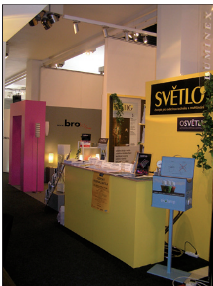
Obr. 1. Expozici časopisu Světlo osvětlovaly světlomety iGuzzini zapůjčené a nainstalované společností Etna; protože bylo krátce před začátkem akce, ve vedlejší expozici českého výrobce osvětlení, společnosti Brokis, ještě vše nesvítilo

Ve dnech 8. až 12. března 2010 se v budově Galerie Mánes na Masarykově náměstí, na trase mezi Národním divadlem a Tančícím domem, v Praze konala specializovaná výběrová výstava svítidel a souvisejícího příslušenství pod názvem Světlo v architektuře. Akci zorganizovala společnost Czech architecture week, pořadatel každoročního festivalu moderní a současné architektury Architecture week ( www.architectureweek.cz ), který má dlouholeté bohaté zkušenosti s pořádáním výběrových akcí podobného charakteru jak v České republice, tak v za-