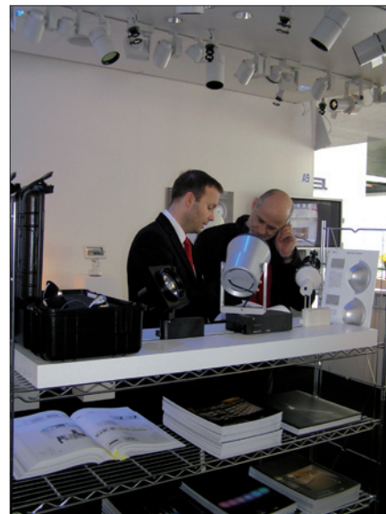
Obr. 4. Mimořádně široká nabídka světlometů v expozici německého výrobce, společnosti ERCO

Výstava byla rozdělena do dvou sekcí. V sekci Light, které patřilo celé přízemí (hala A s vysokými stropy se vstupem přímo z ulice) a část haly B (o patro níž), se představily významné české a světové značky z oboru svítidel a osvětlovací techniky, v hale B na ploše přibližně 250 m 2 byl vybudován ukázkový modelový byt