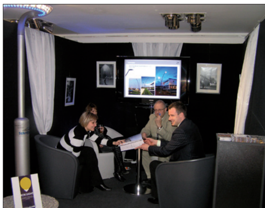
Obr. 9. Společnost Artemnic-Schröder zvolila k prezentaci exteriérového osvětlení útulný interiér, v němž hosty vítali usměvaví zástupci společnosti a pohodlná křesla