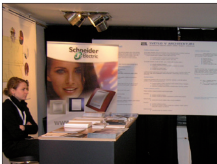
Obr. 12. U vstupu do modelového bytu byla po celou dobu konání výstavy k dispozici informační služba