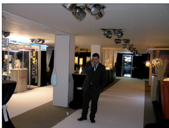
Obr. 8. Pohled do haly B pár minut před začátkem výstavy

inženýrům a developerům. Na tyto cílové skupiny také vystavující společnosti zaměřily své expozice a náplň firemních seminářů a přednášek, které se denně konaly v přednáškovém prostoru v hale A. Ozvučení a osvětlení tohoto prostoru zajistila společnost Osvětlovací technika Vít Pavlů.