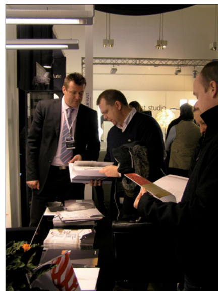
Obr. 5. Pátek, do konce výstavy zbývá půl hodiny a před expozicí švédské společnosti Fagerhult je stále plno