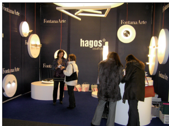
Obr. 2. Eleganční expozice společnosti Hagos, výhradního zástupce italské značky Fontana Arte