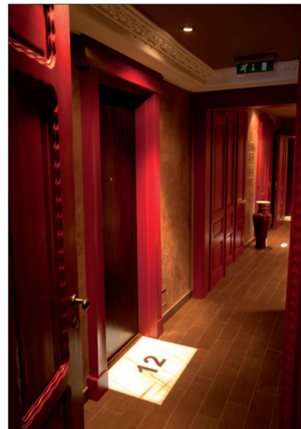
Obr. 3. Originální číslování pokojů – speciální svítidlo Terralux LED zabudované v podlaze vyznačující číslo pokoje

Hotel tvoří 36 luxusních pokojů a tři apartmá, z nichž některé mají vlastní terasu nebo japonskou zahradu. Příjemné prostředí zaručují hostům, spolu s designově čistým nábytkem a luxusními materiály, také špičkové technologie, jejichž prostřednictvím mohou svůj pobyt v hotelu proměnit ve skutečný požitek. Pro aktivní relaxaci je hotel vybaven menším fitness centrem, saunou a vířivými vanami. Vše je umocněno především vlastním značkovým designem, unikátní podmanivou atmosférou, originálním spojením vy-