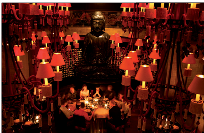
Obr. 5. Tajupná dvoupatrová restaurace s barem, které vévodí barvy červená a zlatá, nádherné látky, propracované lustry vyzařující tlumené světlo, a především mohutný pryskyřicový Buddha důstojně shlížející na celý bar

To se potvrdilo i při realizaci Buddha-Bar hotelu v Praze. Manažer projektu Milan Jandečka spolu s lighting designé-