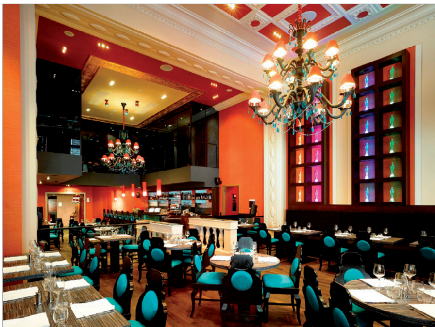
Obr. 4. Skvělá kavárna Siddharta Café, ve které se podává mezinárodní kuchyně včetně snídaně à la carte

Velmi individuálně zde bylo přistupováno ke každému detailu. Pro zajímavost uvedme např. číslování pokojů. Před každými dveřmi do hotelového pokoje je v podlaze zabudováno speciální svítidlo Terralux LED, jež zobrazuje číslo pokoje. Jde o dekorativní osvětlovací systém, který se vyrábí v pochozí protiskluzové úpravě. Jako zdroj světla je použita bílá LED a součástí systému je také difuzní vrstva zajišťující rozptýlení světla. Uvedená svítidla jsou určena k použití v exteriéru i interiéru. Lze je umístit do podlahy nebo dlažby. Skvěle se vyjímají např. v komunikačních zónách, na náměstích, na předváděcích molech, jevištích, popř. jsou vhodná i ke zvýraznění interiéru a exteriéru. Svítidla dodala společnost HORMEN CE a. s. (výrobně-obchodní společnost zabývající se projektoвыми řešeními v oblasti osvětlení). Společnost HORMEN CE a. s. byla oslovena investorem (CPI Hotels) na základě do-