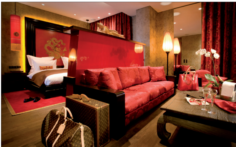
Obr. 1. Apartmány Buddha-Bar jsou vybaveny postelí velikosti king size, dvěma interaktivními televizemi s vysokým rozlišením, šatníky, luxusní, plně vybavenou koupelnou s vířivou vanou jacuzzi, sprchovým koutem s dešťovou sprchou, televizní obrazovkou ukrytou v zrcadle; plocha apartmánu Buddha-Bar je 61 m 2

Hotel okouzluje nejen unikátním designem, ale také gastronomií, jejíž produkty může návštěvník okusit ve dvoupatrové Buddha-Bar restauraci, nabízející 250 míst, které dominuje mohutná pryskyřicová socha sedícího Buddha. Siddarta Café se 100 místy nabízí speciality mezinárodní kuchyně. V Buddha-Bar Shopu si lze koupit originální hudební kompilace hrané v Buddha-Baru a další stylové produkty.