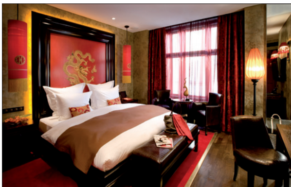
Obr. 2. Pokoje Superior Buddha-Bar jsou vybaveny postelí velikosti king size s povlečením z egyptské bavlny, interaktivní televizí s vysokým rozlišením, šatníky, luxusní, plně vybavenou koupelnou s vanou zdobenou mozaikou, televizní obrazovkou ukrytou v zrcadle; plocha pokoje Superior Buddha-Bar je 35 m 2