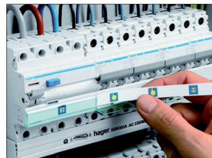
Obr. 3. Jednoduché a rychlé označení přístrojů pomocí popisovacího štítku s průhledným krytem

popis jednotlivých přístrojů prostřednictvím popisových štítků a etiket. S využitím Semiologu lze štítky pro označení obvodů navrhnout a vytisknout. Štítky působí velmi esteticky, ale zároveň jsou i praktické. Pro tvorbu štítků je možné volit z řady barevných i čer-