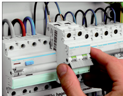
Obr. 2. Nový upevňovací systém umožňuje demontáž jističe z řady přístrojů i při jejich propojení pomocí propojovacích lišt

Naprostou novinkou je softwarové řešení 1-2-3 schéma, pomocí kterého je možné navrhovat liniové schéma a připravit si tak kvalitní technickou dokumentaci pro výrobu a montáž rozváděčů. Součástí tohoto nástroje je i modul Semiolog, který umožňuje