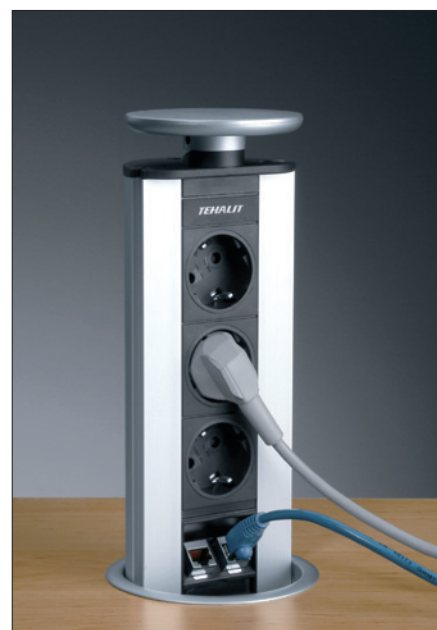
Obr. 4. Vestavný zásuvkový sloupek se 3 zásuvkami 230 V a dvojitou zásuvkou pro přenos dat