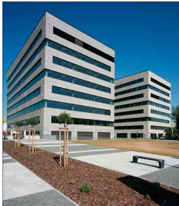
Obr. 3. Administrativní centrum Prosek Point

a jiných prostor v Praze, v západní Evropě i v zámoří. Toto postavení chceme udržet a dále rozvíjet. Je to úspěch, který nás zavazuje. Již nyní připravujeme novinky pro naši expozici na veletrhu Light+Building, který se bude konat 11. až 16. dubna 2010 ve Frankfurtu nad Mohanem. Jde o největší evropský veletrh osvětlovací techniky. Rádi vás přivítáme v našem stánku č. 4.2 E40.“