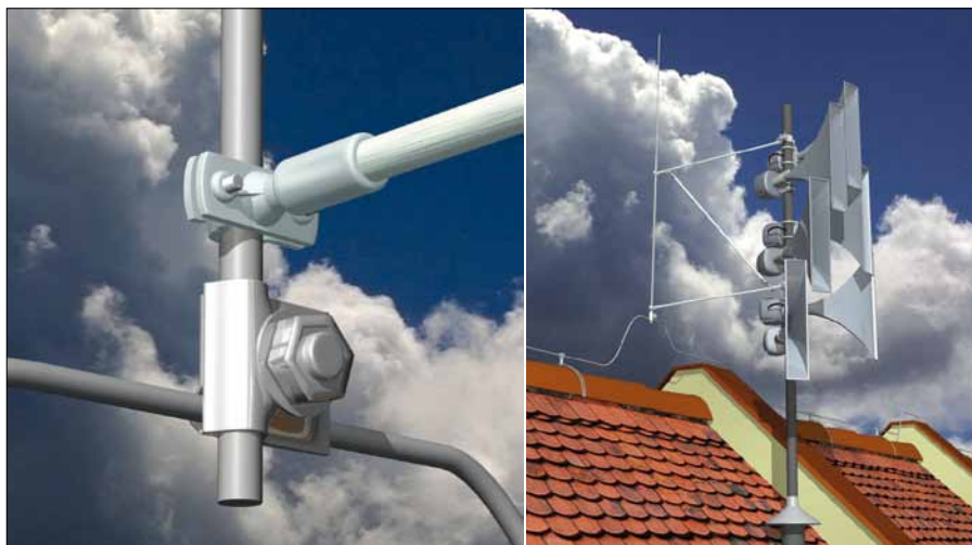
Obr. 1. Konstrukční prvky DEHNiso Combi

Nejprve je třeba důkladně zkontrolovat střechu, zda není materiál střechy vodivý. Tomuto kroku by měla být věnována opravdu velká pozornost. Z vlastní zkušenosti víme, že i to, co vypadá jako nevodivá střecha, může být dost vodivé (kovové nosníky, parotěsné fólie nebo i např. betonové tašky na staré plechové střeše). Po pečlivém ověření nevodivosti střechy, lze přistoupit k vlastnímu oddalování.