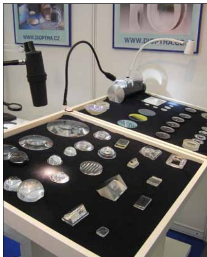
Obr. 1. Různé možnosti povrchových úprav reflektorů a čoček a speciální svítidla LED včetně dalších optických produktů představil český výrobce, společnost Dioptra

poslanci, senátoři, rektori VŠ a další hosté. Zdůrazněné téma energetika se odrazilo ve vysoké účasti odborníků na mezinárodní konferenci Jádro proti krizi? , značný zájem vzbudil projekt Moderní zdroje