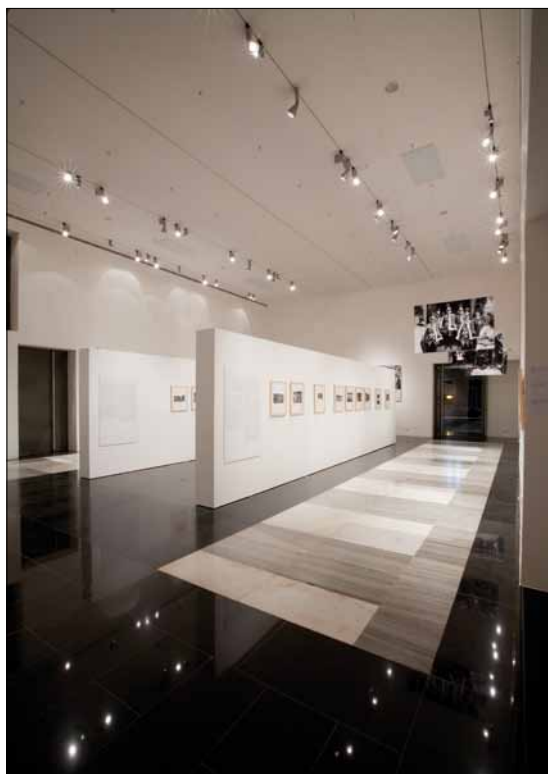
Obr. 4. Prostor pro krátkodobé výstavy

stavy ovlivněno požadavkem na maximální jednoduchost kabelových tras. Nová svítidla byla navržena tak, aby byla co nejméně svázána se stavbou, všude, kde to bylo možné, jsou součástí vkládaných