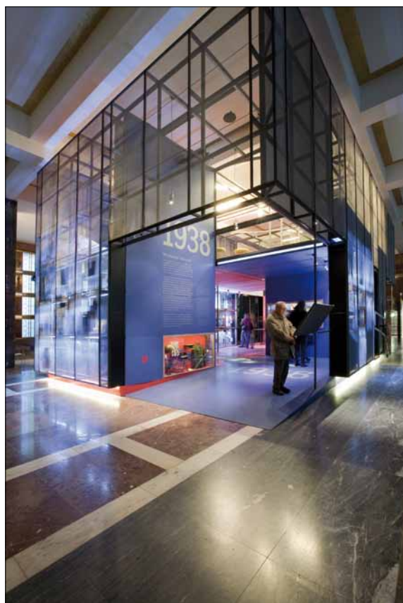
Obr. 2. Kaaba – centrum trvalé expozice

Od roku 1951 byly v památníku ukládány ostatky významných představitelů KSČ a v období od roku 1953 do roku 1962 fungoval jako mauzoleum K. Gottwalda. Kromě oficiálních akcí upadla budova do obecného nezájmu. Po roce 1989 byly všechny ostatky převezeny do soukromých hrobů a v roce 2001 byla budova předána do správy Národního muzea, které se zaměřilo na její rekonstrukci, revitalizaci a rehabilitaci v očích veřejnosti.