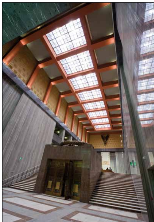
Obr. 5. Slavnostní sál

Vzhledem k charakteru a konstrukci budovy bylo rozmístění osvětlovací sou-