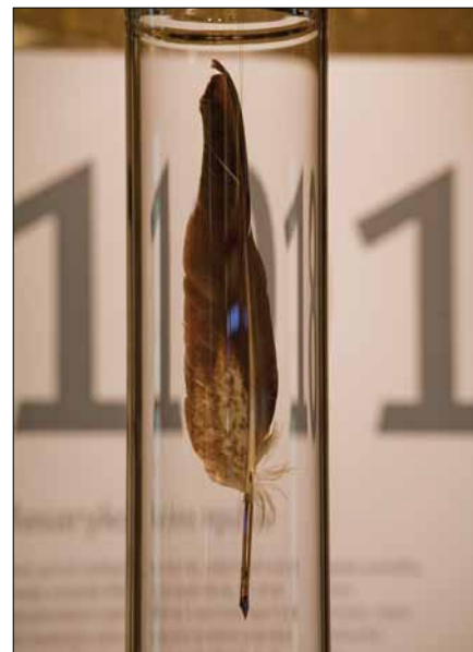
Obr. 3. Zlaté pero s orlím brkem, kterým T. G. Masaryk podepsal deklaraci samostatnosti Československého státu