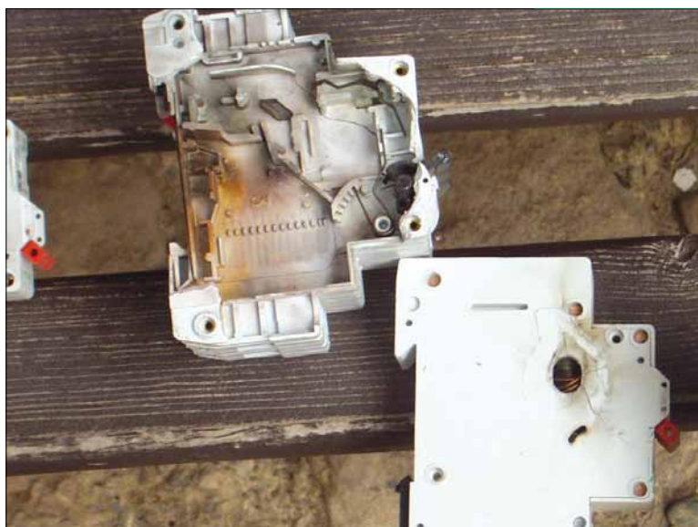
Obr. 2. Jističe poškozené bleskovým proudem

pájení všech zařízení umístěných v zóně LPZ 0, např. na střeše či okolí domu (viz Tipy a Triky 5. část). Může se jednat až o desítky vývodů separátně odjištěných s tím, že je akceptována varianta obětování všeho mimo objekt včetně jističů. V tomto případě je bezpodmínečně nutné ochránit osoby v objektu před zavlečením bleskového proudu. K tomu sice postačí jeden svodič typu 1, ale málokdo si dokáže pod slovem obětování představit, co to s jističem udělá. Toto doporučení jsme zatím v žádném z norm nenašli, ale vychází ze zkušeností z praxe.