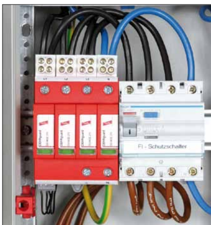
Obr. 1. Svodič přepětí DEHNguard M před proudovým chráničem

Způsoby použití SPD řeší ČSN 33 2000-5-534, kde lze najít mnoho příkladů zapojení svodičů v koordinaci s proudovými chrániči. Nelze si ovšem nepovšimnout, že uváděné zapojení v sítích TN-S, kde svodič přepětí je zapojen za proudovým chráničem, není např. v Německu dovoleno (každému, kdo četl předchozí odstavec, je jasné asi proč).