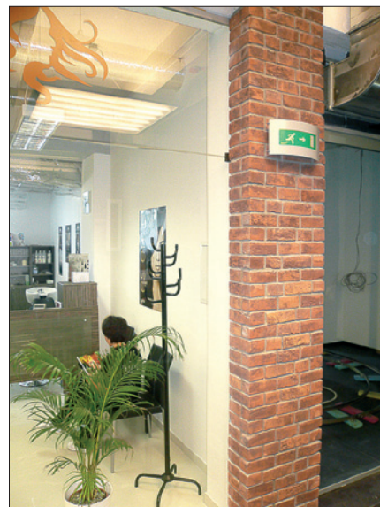
Obr. 7. Núdzové svetidlo Grandlux 9 W/1 h – chodba obchodného priestoru

začiatku. Nakoľko ide o historickú budovu, ktorá zachováva prvky pôvodnej architektúry a zároveň ich kombinuje s modernými riešeniami, bol výber správnych svetidiel o to zložitejší. Základnou požiadavkou na svetidlá bol jednoduchý tvar a ich dokonalé zakomponovanie do priestoru budovy. Pre hlavné osvetlenie kori-