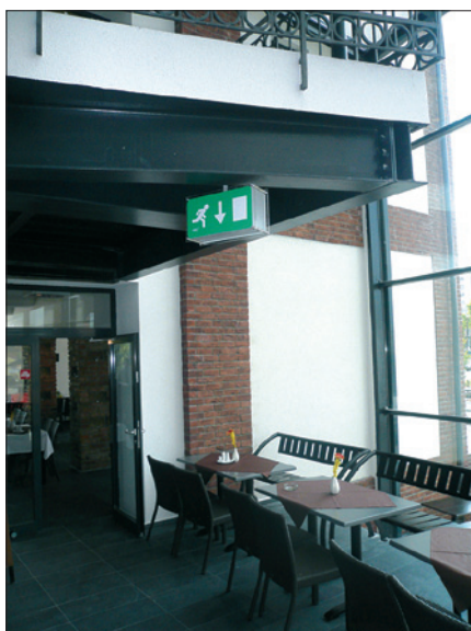
Obr. 6. Núdzové svetidlo Prolux-Top 8 W/1 h v reštaurácii

– v akcentovaní symbolu výroby charakteristickej pre Žitný ostrov. Z architektonického hľadiska ide o kvalitnú architektúru z obdobia moderny, po funkčnej, konštrukčnej i materiálovej stránke, ktorá pravdivo vyjadruje svoju náplň. Vysoká estetická hodnota pôvodnej architektúry je prítomná v kompozícii hmôt aj v architektonických detailoch fasád. Snahou celkového návrhu bolo rešpektovať historické architektonické znaky objektu a vyjadriť novú funkciu len v dodatočných dostavbách. Zachováva sa tu autenticita a celistvosť pôvodných objektov.