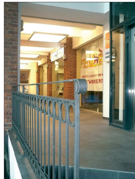
Obr. 4. Svetidlá Wega-A-Prisma 6x 54 W – chodba obchodného priestoru

roky chátral. Avšak architektúra, priaznivá poloha v rámci sídla a dostatok priestoru v rámci pozemku pre rozvoj statickej dopravy predurčovali objekt pre ďalšie zhodnotenie. Zvrát v osude mlynu nastal vďaka vypracovaniu zámeru na konver-