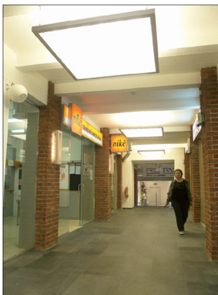
Obr. 3. Svetidlá Wega-A-Prisma 6x 54 W – chodba obchodného priestoru

nadzemné podlažia (NP) slúžia ako nákupné centrum, tretie a štvrté NP tvorí hotelovú a administratívnu časť. Projekt zachováva „hmotovú“ substanciu celého výrobného závodu – všetky konštrukcie hlavných budov, priemyselný výraz exteriéru budovy, vrátane architektonických detailov. Celková rozloha nákupného centra je 4 800 m 2 . Na prvom NP je reštaurácia a kaviareň, v prvom PP a druhom NP