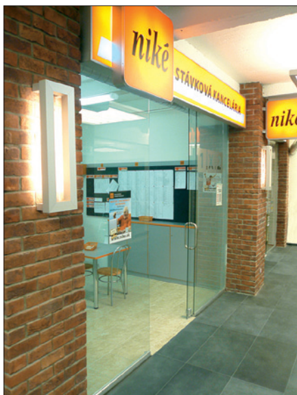
Obr. 2. Svetidlá Wega-E-Frame 2x 24 W – chodba obchodného priestoru

stavený na križovatke dopravnej tepny v smere Bratislava–Komárno s odbočkou na Senec. Útlm poľnohospodárskej výroby pozastavil činnosť mlynu a areál dlhé