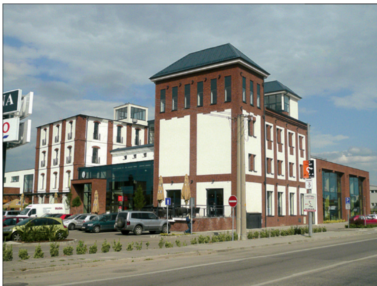
Obr. 1. Centrum Aréna – celkový pohľad na budovu

Celý komplex pozostáva zo šiestich vzájomne prepojených objektov, z ktorých dva sú rekonštruované historické budovy, doplnené o novostavby. Prvé dve