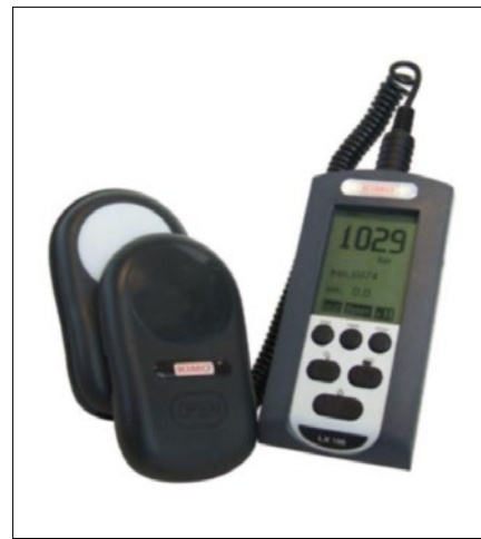
Obr. 7. Luxmetr KIMO LX 100