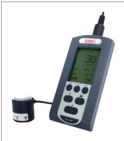
Obr. 6. Solarimetr KIMO SL 100