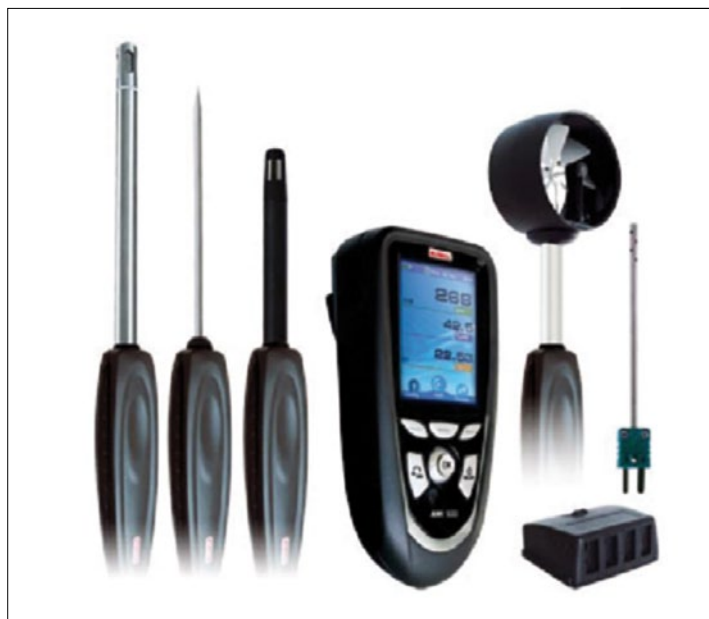
Obr. 3. AMI 300 – univerzální měřicí přístroj