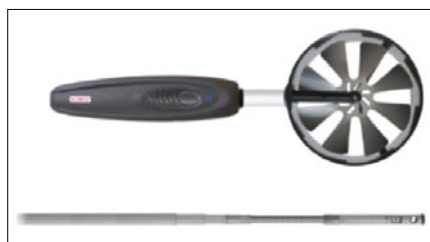
Obr. 5. Sondy pro měření rychlosti proudění vzduchu