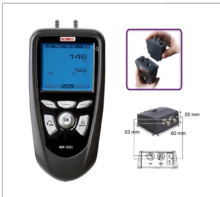
Obr. 2. Přístroje Class 200 využívají výměnné moduly

Modelová řada Class 100 je zastoupena jednoúčelovými měřicími přístroji s jedním nebo se dvěma kanály (např. odporový teploměr nebo teploměr s termočlánkem) a přístroji kombinujícími některé funkce (teplota + relativní vlhkost, tlak + rychlost proudění apod.) – viz obr. 1.