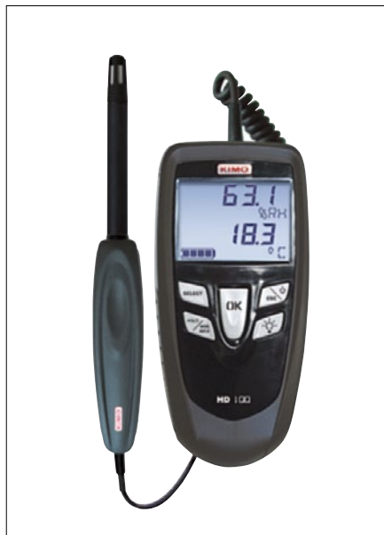
Obr. 1. HD 100 – přístroj pro měření teploty a relativní vlhkosti

Ruční měřicí přístroje KIMO se vyrábí ve třech modelových řadách Class 100, Class 200 a Class 300, přičemž v každé řadě jsou zastoupeny modely pro měření teploty, tlaku, relativní vlhkosti, rychlosti proudění vzduchu, otáček, kvality vzduchu, hluku, luxmetry a další.