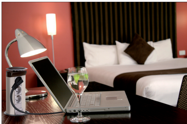
Obr. 2. Výsuvný sloupek Teleblock