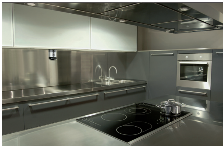
Obr. 3. Sloupek Teleblock zavěšený shora