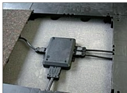
Obr. 5. Rozbočný box Meyer

ve velkoplošných kancelářích, jednotlivé stoly s možností připojit laptop (datová síť, elektrická síť) nebo lokální svítidlo k osvětlení pracoviště, dále v kancelářských prostorách s větším obsazením uživateli, zkrátka všude tam, kde je nutná snadná a rychlá dostupnost připojení silových a datových rozvodů, je možné použít přípojné zásuvkové boxy, jejichž vstupy jsou osazeny konektory gesis (obr. 1).