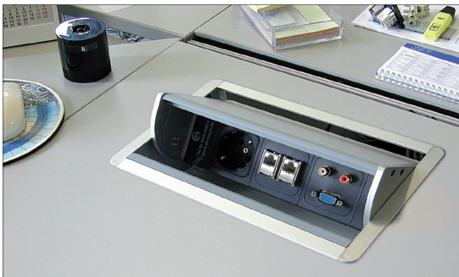
Obr. 1. Výklopný Netbox Axial

Systém gesis je vyráběn v různých barvách a s kódováním, které omezuje možnost jeho chybného zapojení. Jsou-li kabely požadovaných délek osazeny konektory přímo výrobcem, je toto zapojení strojově vyzkoušeno; tím se zamezuje vzniku požáru iniciovaného jiskřením na kontaktních částech. Prefabrikované komponenty kompletního konektorového systému umožňují přivést napájení od rozváděče ke koncovým prvkům, kterými mohou být nejenom svítidla, ale také podlahové kra-