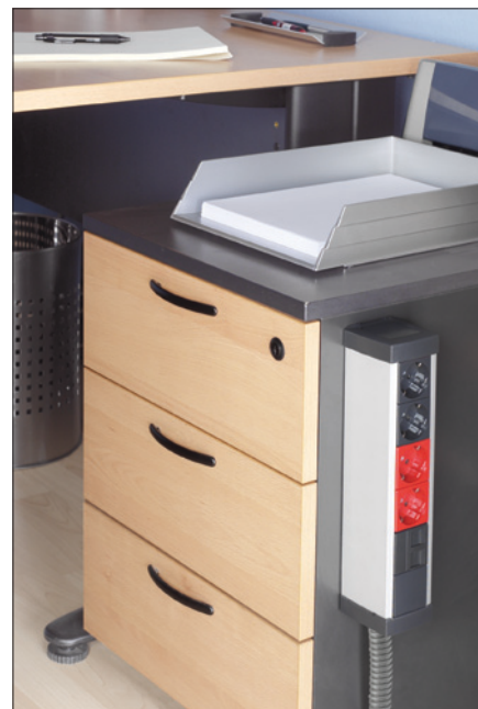
Obr. 4. Přístrojový kanál na pracovním stole

bice, zásuvkové boxy – tzv. přípojná místa, vypínače a další spotřebiče. Kompletní elektroinstalaci tak lze připravit a vyzkoušet před dodáním koncových zařízení. Flexibilita elektroinstalace, jednoduché přidání či odebrání koncových prvků, je další výhodou systému gesis .