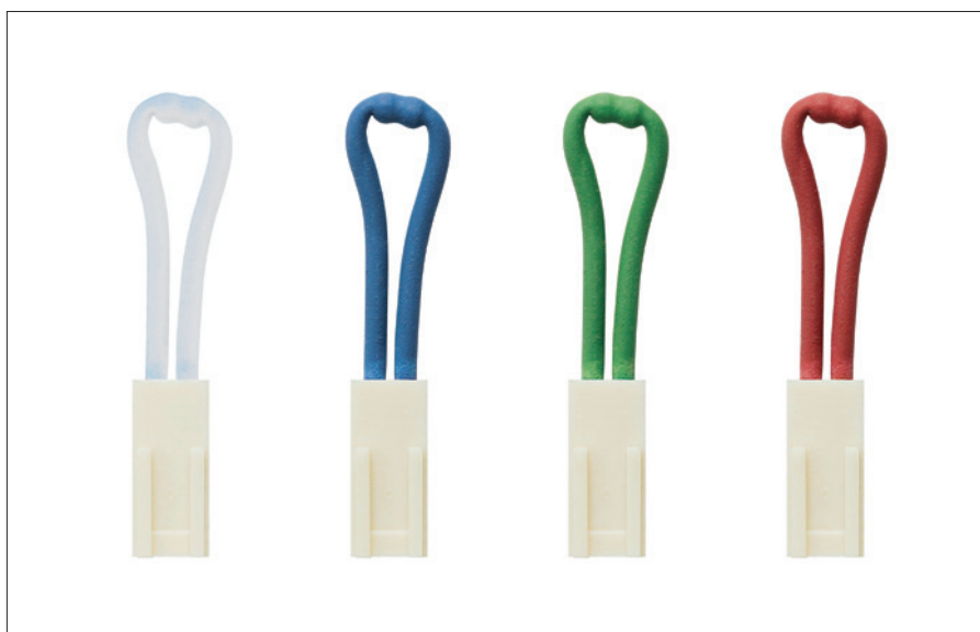
Obr. 4. Zástrčky („plug“) pro předřadníky PCA T5 EXCEL one4all Ip x!tec

Také při připojení na řídicí a ovládací panely x-touchPANEL, popř. x-touchBOX, se uživatel přesvědčí, že systém