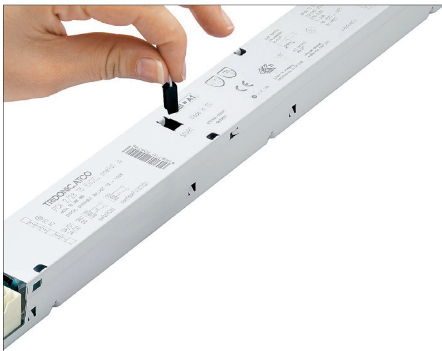
Obr. 3. PCA T5 EXCEL one4all Ip x!tec s funkcí plugADDRESSING

podle vestavěného kalendáře jsou okamžitě k dispozici.