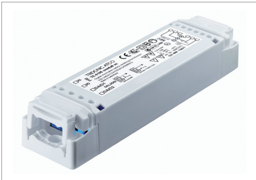
Obr. 1. Transformátor TE 0105 one4all sc B s funkcí corridor

Transformátory (obr. 1) jsou řízeny prostřednictvím připojených běžných čidel pohybu. Jestliže čidlo zaznamená pohyb, transformátor okamžitě rozsvítí připojené zdroje na požadovanou hodnotu. Je-li prostor bez osob, zdroje se setmí na nastavenou hodnotu, a tím sníží spotřeba elektrické energie. Kromě hodnot předem nastavených ve výrobě lze individuálně přeprogramovat maximální a minimální hodnoty, stejně jako časy, které určují dobu přechodu z maximální hodnoty na minimální, popř. je možné nastavit zpoždění do úplného vypnutí. Teoreticky lze na jedno čidlo připojit libovolné množství předřadníků nebo jeden transformátor ovládat libovolným počtem čidel. Anebo něco