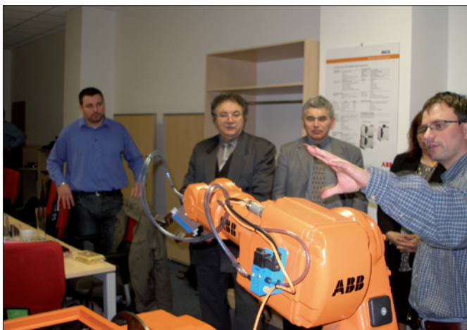
ABB je jednou ze společností zapojených v aktuálním ročníku programu

V uplynulých dnech studenti absolvovali pohovory imitující skutečnou atmosféru i otázky „ostrého pohovoru“ s odborníky na lidské zdro-