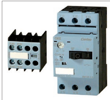
Obr. 1. Conteo – přístroje pro spínání a ovládání

spouštěče motoru s jednou velikostí (velikost 1) a jmenovitým proudem 25 A. Tyto přístroje se ve firmě OEZ vyrábějí již delší dobu a nyní jsou součástí produktové řady Conteo.