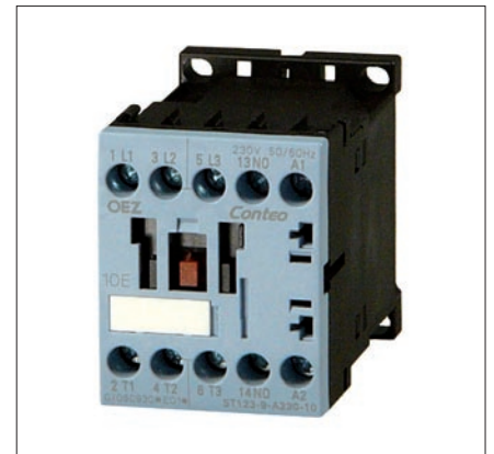
Obr. 3. Stykač ST123-9-A230-10

Jednotlivé podskupiny jsou dále členěny na čtyři velikosti podle maximálního proudu přístrojů (velikost 12, 25, 50 a 100). Výjimku tvoří pouze ekonomické