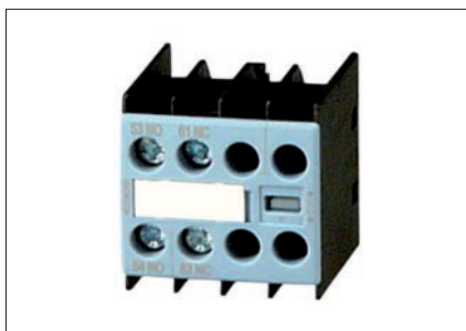
Obr. 4. Pomocný spínač PS-ST12X-C11