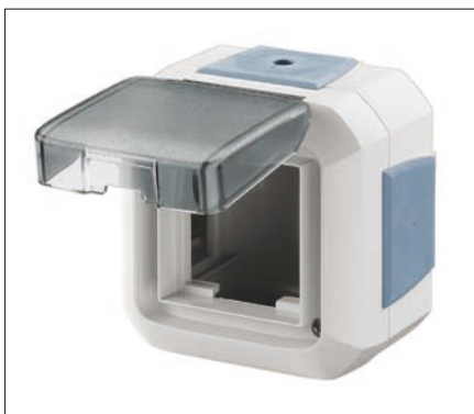
Obr. 8. Krabice 3903N-C06541 M z řady Variant+ pro Profil 45

to zásuvek, která činí 35 mm, umožňuje jejich jednoduchou instalaci v obou jmenovaných systémech.