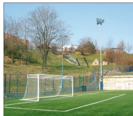
Obr. 4. Osvětlení fotbalové hřiště v Bohunicích bylo možné díky stožárům od Vysto Kobylí

Osvětlování sportovišť (Jiří Hochman): jak lze osvětlovat vnitřní i venkovní sportoviště, aby bylo zajištěno kvalitní osvět-