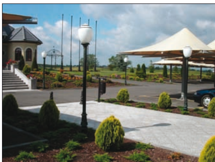
Obr. 1. Osvětlení relaxační zóny golfového areálu dekorativními svítidly Art Metal

Sport je činnost, při níž více než jinde rozhoduje zrakový vjem (snad kromě šachů, které lze hrát i z paměti). Proto se