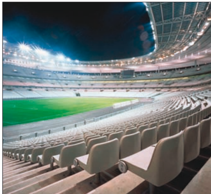
Obr. 2. Stadion v St. Denis ve Francii osvětluje světlomety Siteco

městského mobiliáře. Dalším je světový výrobce a dodavatel světelných zdrojů Osram . Stejně známý je i přední výrobce svítidel Siteco . V sortimentu má nejen „klasické“ světlomety pro osvětlování sportovišť, ale i netradiční osvětlování, které využívá techniku zrcadel (viz Světlo 2/2008, str. 26). Bez osvětlovacích stožárů by ve většině případů nebylo možné osvětlovat venkovní sportoviště. Proto zmíněnou trojici firem doplňuje výrobce zároveň zinkovaných stožárů Vysto Kobylí . Tato česká společnost zvládla technologii ochrany stožárů „termoplastováním“, které významně prodlužuje jejich životnost (téměř zcela eliminuje působení nepříznivých vlivů okolí).