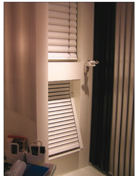
Obr. 10. Jeden ze stmívacích systémů v expozici společnosti INNEX