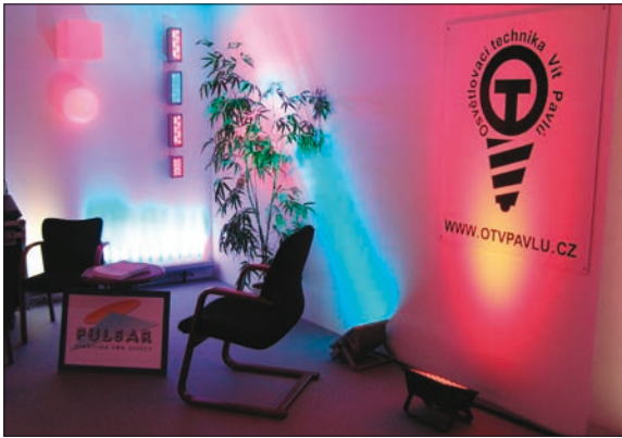
Obr. 5. Světelnotechnické prostředky pro scénické a architekturní osvětlení v nabídce OST Vít Pavlů