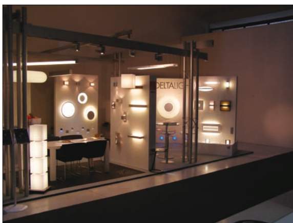
Obr. 3. Široká nabídka interiérových svítidel ve stánku Delta Light