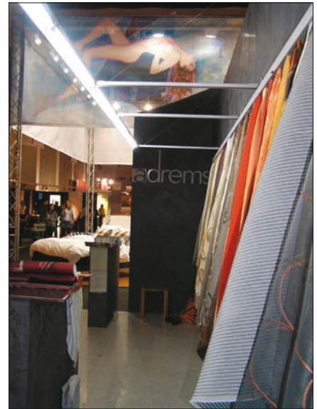
Obr. 9. Jednoduše a účelně vyřešila svépomocí osvětlení vystavených produktů společnost Adrems, dodavatel stínících systémů „na klíč“ (detail stánku)

Polská výstava Současná architektura Varšavy představila ve fotografiích dvacet stavebních projektů realizovaných ve Varšavě v letech 1994 až 2005, jejichž autory jsou jak polští, tak zahraniční architekti. Konala se jako součást Dnů Varšavy v Praze v respiriu pátého patra Veletržního paláce 30. září až 2. listopadu 2008. Italská výstava Cesta k pomalé architektuře přiblížila prostřednictvím několika zajímavých projektů, které realizovalo studio Frigerio Design Group, koncepci zakladatele „pomalé architektury“, italského architekta Enrica Frigeria, charakterizovanou jeho slovy takto: „Metody, měřítka času a procesy 'pomalé architektury' jsou prostě takové, že zcela vylučují globalizaci. Žádnou inovaci nelze osvobodit od povinnosti respektovat dané místo, svéráznost kořenů, jedinečnost, bohaté možnosti stavby ne kdekoliv, ale právě zde: pomalu, progresivně, v průběhu času.“ Výsta-