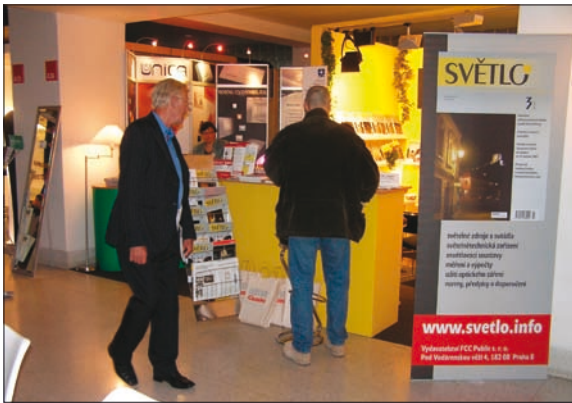
Obr. 6. O jeden ze zděných boxů haly B se dělí časopis Světlo s nabídkou FCC Public, vydavatelství časopisů Automa, Elektro, Světlo a odborných publikací, a společnost Schneider Electric, výrobce elegantních elektroinstalačních přístrojů