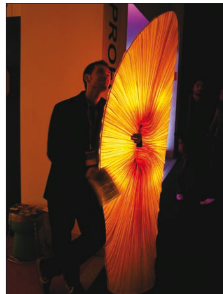
Obr. 4. Jedno z dekorativních látkových svítidel z produkce izraelské firmy AQUA creations, představených společností PROFI lighting

Již druhým rokem byl průvodcem realizací pražských developerů a realitních kanceláří projekt Happy Home, umožňující osobní srovnávání jednotlivých lokalit a nabídek. Autobusy speciálních autobusových linek měli zájemci možnost navštívit pět takovýchto míst v Praze. K této akci byl vydán průvodce s informacemi o zúčastněných společnostech a s popisem objektů, které si návštěvníci mohli na jednotlivých zastávkách autobusu prohlédnout.