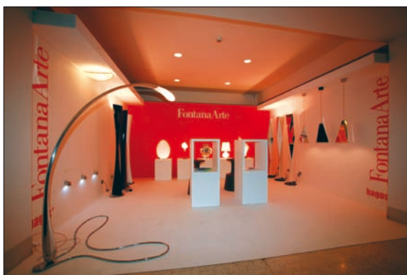
Obr. 1. Vybrané produkty Fontana Arte představila společnost Hagos

Součástí expozic časopisu Světlo (již tradičně osvětleného světlometry iGuzzini, zapůjčenými firmou Etna) a společ-