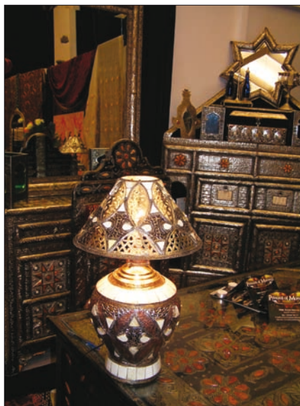
Obr. 8. Orientální stolní svítidlo v expozici Princess of Morocco

va se konala na ochozu pátého patra Veletržního paláce 1. října až 2. listopadu.