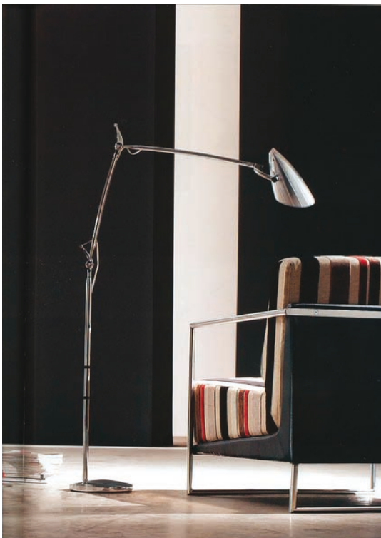
Obr. 9. Stojanové svítidlo Perceva 06, přihlášené společností ACW s. r. o., získalo cenu soutěže In-Light