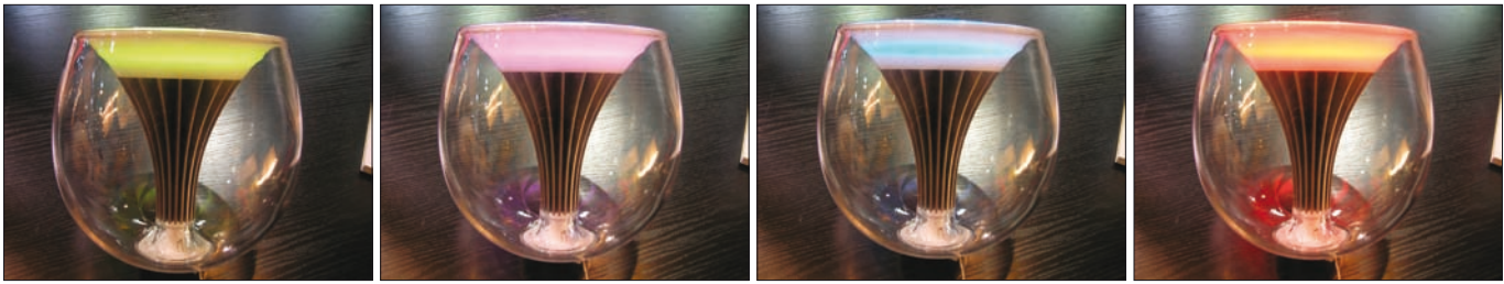
Obr. 7. Svítidlo Philips Livingcolours, přihlášené společností Philips, získalo hlavní cenu soutěže In-Light