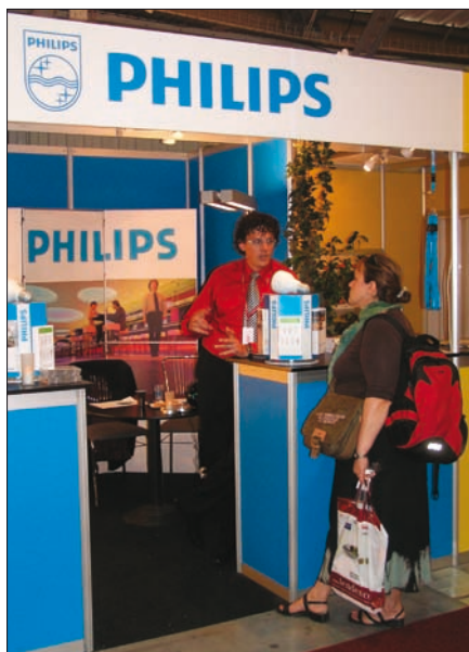
Obr. 2. Ve stánku Philips zájemcům poradili, jak se vyznat v široké nabídce moderních světelných zdrojů

tace, regenerace a estetika) a vybavením pro hotely a restaurace. Na výstavní ploše 20 958 m 2 se představilo 302 vystavovatelů z Česka a zahraničí.