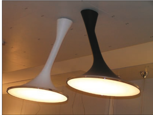
Obr. 10. Stropní svítidlo Noaxis z nabídky společnosti Hagos s. r. o., oceněné odbornou komisí mimo přihlášené exponáty