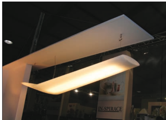
Obr. 11. Světelný objekt Mouette z nabídky společnosti Artemide, oceněný odbornou komisí mimo přihlášené exponáty

Další dvě ceny bez udání pořadí získaly: stropní svítidlo LED ZIXI 933 , přihlášené společností Luminex spol. s r. o. (Zdůvodnění: Interiérové stropní přisazené svítidlo se zajímavou kombinací halogenových žárovek s diodami LED umožňující účelové i doplňkové osvětlení s vhodným barevným řešením osvětlovací scény. Pozoruhodný je variabilní stavebnicový systém vycházející ze čtvercových modulů.), a stojanové svítidlo Perceva 06 společnosti ACW s. r. o. (Zdůvodnění: Standardně koncipované stojanové svítidlo s možností vertikálního a horizontálního nastavení ramene i stínidla. Porotu zaujalo precizní zpracování detailu svítidla s využitím organického tvarování nosné konstrukce. Svítidlo je nabízeno i ve variantě nástěnné a stolní.).