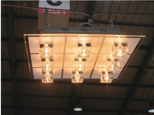
Obr. 8. Stropní svítidlo LED ZIXI 933, přihlášené společností Luminex spol. s r. o., získalo cenu soutěže In-Light