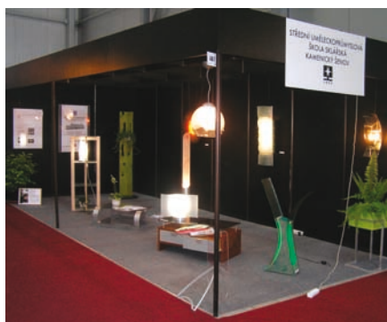
Obr. 4. Společná expozice SUPŠS z Kamenického Šenova a VOŠUP a SUPŠ Praha 3