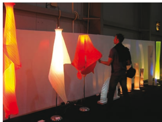
Obr. 5. Zleva DaMaHug a Voodoo v sekci designu