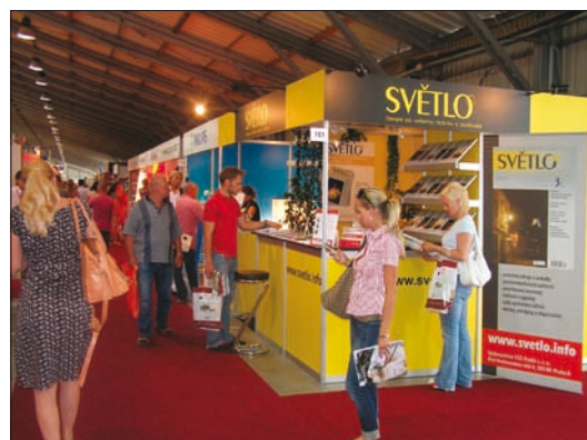
Obr. 3. Informace z oboru osvětlení mohli zájemci získat ve stánku časopisu Světlo

Druhé z vybraných novinek, soutěži In-Light, patří zbytek článku.