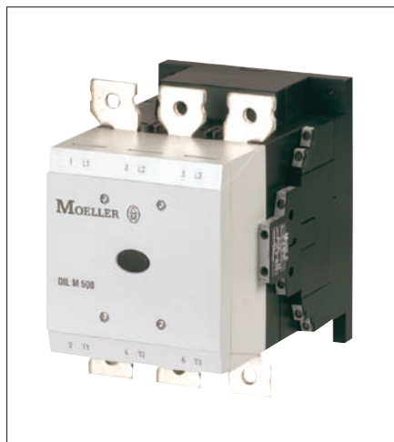
Obr. 2. Výkonový stykač DILM580 pro spínání motorových zátěží