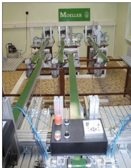
Obr. 1. Pohled na dopravníky

procesu. Analogovými výstupy řídicích relé EASY800 je ovládána rychlost použitých dopravníků. O změnu rychlosti se starají měniče frekvence DF51. Celou aplikaci je pak možné řídit přes dotykový displej XV200, který se zároveň používá i pro vizualizaci.