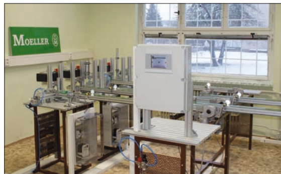
Obr. 2. Sestavená aplikace výrobní linky

Cílem tohoto projektu bylo vybudování výrobní linky, která studentům přiblíží a objasní problematiku průmyslových instalací za použití moderních průmyslových komponent.