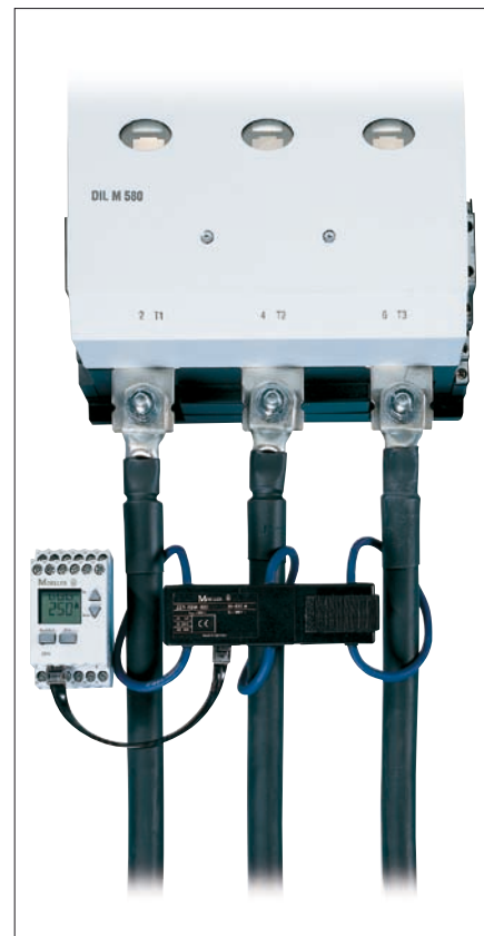
Obr. 4. Elektronické nadproudové relé ZEV se snímačem proudu do 820 A

Stykače DILH a také DILM se používají v různých aplikacích s požadavkem na oddělení obvodů s kategorií užití AC-1, např. jako přístroje pro připojení generátorů větrných elekt-