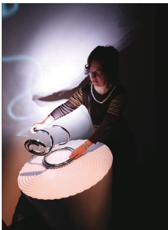
Obr. 2. Představení PizzaKobra v prezentačních prostorách společnosti Etna