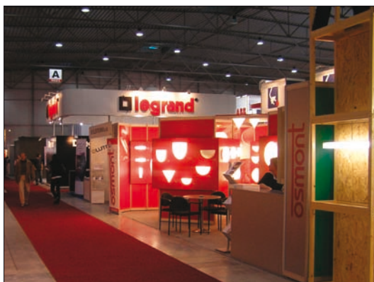
Obr. 4. Český výrobce svítidel, společnost Osmont (vpravo)

technika, televizní a telekomunikační zařízení v budovách, signální, zabezpečovací a informační technika budov, měřicí a regulační technika, elektronika, stroje, zařízení a nářadí pro elektroinstalace a opravy a rovněž služby.