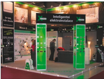
Obr. 6. Inteligentní elektroinstalace společnosti Moeller

viště ČR. Také letos byly součástí veletrhu tradiční soutěže: soutěž o nejlepší expozici Top Expo , soutěž o nejlepší výrobek-novinku (exponát For Arch) na českém