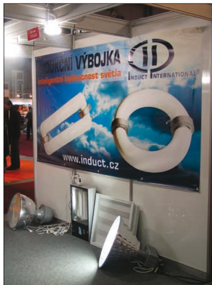
Obr. 10. Čestné uznání Grand Prix For Arch 2008 pro indukční výbojku (dodavatel Induct International s. r. o.) Indukční výbojka nemá elektrodu, energii získává z vysokofrekvenčního magnetického pole. Tato konstrukce řeší problémy spojené se stárnutím elektrod u jiných výbojek a zajišťuje bezúdržbovost a dlouhý život výbojky (60 až 100 tisíc hodin). Výbojka je energeticky úsporná, ekologická (neobsahuje rtuť), záruka je deset let.

trhu Grand Prix (uděleno bylo pět hlavních cen a sedm čestných uznání) a Dopravní stavba roku . Zapomenout nelze ani na dvanáctý ročník Soutěže učňů stavebních oborů (SUSO) .