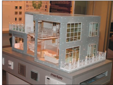
Obr. 12. Funkční model vily ve stánku společnosti Schneider k názorné demonstraci řídicích systémů

trhu Grand Prix (uděleno bylo pět hlavních cen a sedm čestných uznání) a Dopravní stavba roku . Zapomenout nelze ani na dvanáctý ročník Soutěže učňů stavebních oborů (SUSO) .