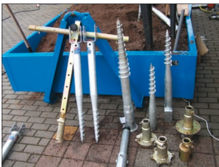
Obr. 7. Cena Grand Prix For Arch 2008 pro zemní vrtut Krinner (generální dovozce Trading LAMA) Unikátní systém pro zakládání staveb (kotvení) s nejvyšší stabilitou (staticky ověřeno na tlakovou, tahovou i boční zátěž), technický princip je patentován. Základy jsou vybudovány během několika minut (bez výkopů a betonování) a jsou okamžitě zatížitelné. Po demontáži stavby lze vrtuty vyjmout a opakovaně použít. Rozměry vrtutů: 0,5 až 3 m. Příklady použití: dřevostavby, městský mobiliář, osvětlení, solární panely, reklamní tabule, ukazatele aj.