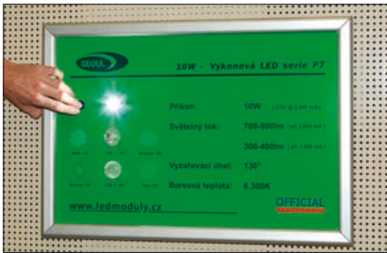
Obr. 5. Moduly LED v nabídce distributora elektronických součástek, společnosti Official Electronic

viště ČR. Také letos byly součástí veletrhu tradiční soutěže: soutěž o nejlepší expozici Top Expo , soutěž o nejlepší výrobek-novinku (exponát For Arch) na českém