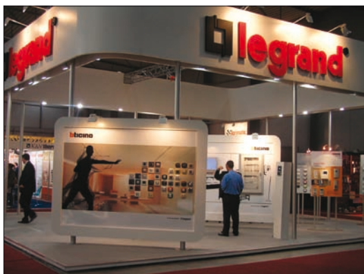
Obr. 3. Zajímavě řešená expozice společnosti Legrand