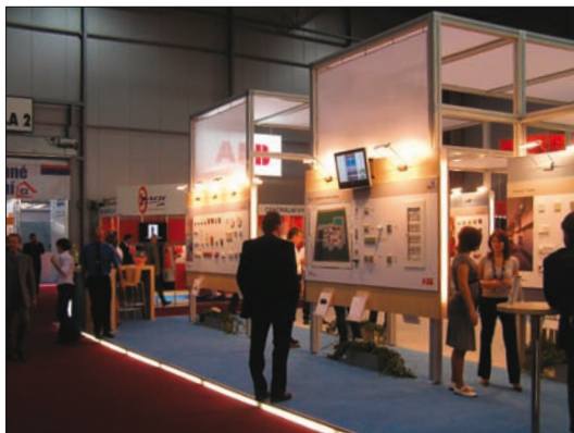
Obr. 2. Tradičně velmi přehledně uspořádaná široká nabídka produktů společnosti ABB Elektro