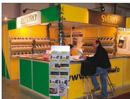
Obr. 1. Expozice časopisů Světlo a Elektro

Mezinárodní stavební veletrh For Arch se letos konal již podevatenácté. Ve vyprodaném areálu PVA Letňany na výstavní ploše větší než 25 000 m 2 představilo ve dnech 23. až 27. září 2008 svoji produkci 1 039 společností z dvaceti zemí světa (Belgie, Běloruska, Bulharska, České republiky, Číny, Dánska, Estonska, Finska, Chorvatska, Maďarska, Německa, Nizozemí, Polska, Rakouska, Ruska, Slovenska, Španělska,