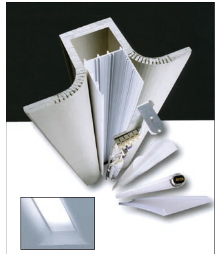
Obr. 11. Čestné uznání Grand Prix For Arch 2008 pro System TZ-50 (výrobce Schmitz - Leuchten GmbH & Co. KG, dodavatel Profi lighting, s. r. o.)

Designová novinka určená do sádkartonových stropů a zdí. Sádkartonové moduly a kompletní sada všech součástek umožňují rychlou a jednoduchou instalaci. Tato technika zaručuje čistotu hran otvorů bez dalších nerovností. Oblé linie působí neobvyklým architektonickým dojmem. Vhodně umístěné zdroje s matným nebo opálovým akrylátovým krytem v různých tvarech zaručují měkké světlo po celé délce systému. Délky světelných korýtek - kanálů o šířce 580 mm až 4 240 mm umožňují široké možnosti použití v interiéru.