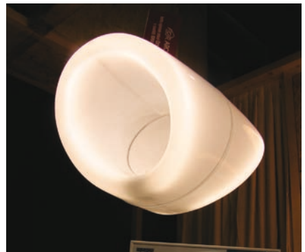
Obr. 9. Čestné uznání Grand Prix For Arch 2008 pro svítidlo Engine (výrobce ATEH, spol. s r. o.) Svým vzhledem a funkcí ojedinělé závěsné svítidlo (i s ohledem na výrobky EU) z organického skla (plexi), světelný zdroj: kruhová zářivka 2x 60 W, 2GX13, rozměry: 632 x 422 x 357 mm (další podrobnosti viz Světlo 5/2008, str. 32 až 33)

Designová novinka určená do sádkartonových stropů a zdí. Sádkartonové moduly a kompletní sada všech součástek umožňují rychlou a jednoduchou instalaci. Tato technika zaručuje čistotu hran otvorů bez dalších nerovností. Oblé linie působí neobvyklým architektonickým dojmem. Vhodně umístěné zdroje s matným nebo opálovým akrylátovým krytem v různých tvarech zaručují měkké světlo po celé délce systému. Délky světelných korýtek - kanálů o šířce 580 mm až 4 240 mm umožňují široké možnosti použití v interiéru.