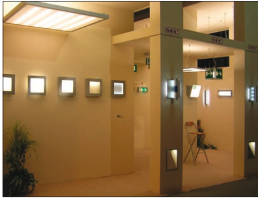
Obr. 1. Z nabídky slovenského výrobce SEC

Od 16. do 19. října se prostory Výstaviště TMM v Trenčíně staly již počtrnácté dějištěm mezinárodního veletrhu ELO SYS. Organizátor (Expo Center) v letoš-