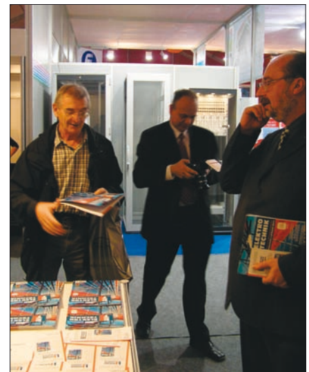
Obr. 5. Na veletrhu ELO SYS bylo představeno nové číslo slovenského časopisu Elektrotechnik , který vydává dceřiná společnost vydavatelství FCC Public, vydavatelství Otagon ( www.oktagon.sk )

borné veřejnosti. Bohatý doprovodný odborný program (konference, semináře a panelové diskuse) připravil organizátor ve spolupráci s odbornými garanty veletrhu. Například iniciátorem a odborným garantem konference Elektrotechnika, informatika a telekomunikace byla Fakulta elektrotechniky a informatiky STU v Bratislavě, trojici přednášek na téma Využití termovize při diagnostice elektrických zařízení, Nové řešení nouzového osvětlení a osvětlení budov