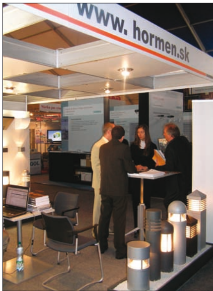
Obr. 2. Letos se na veletrhu představila slovenská pobočka společnosti Hormen