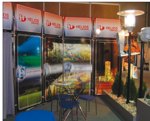
Obr. 4. Z produkce slovenské firmy Helios lighting

Na celkové ploše 18 658 m 2 se představilo ve všech nomenklaturách veletrhu (elektroenergetika a silnoproudá elektrotechnika, osvětlovací technika, elektronika, telekomunikační a radiokomunikační technika, výpočetní technika, měřicí a regulační technika, elektrotechnické materiály, elek-