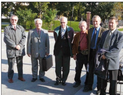
Obr. 1. Skupinka moravských elektroodborníků na veletrhu Vienna-Tec 2008

Elektrotechnici z Brna a okolí navštívili 7. října 2008 mezinárodní veletrh Vienna-Tec 2008, který se konal od 7. do 10. října ve veletržním centru ve Vídni. Pozvání zorganizovala Sekce elektrotechniků jižní Mora-