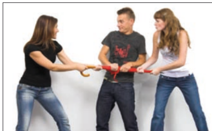
Obr. 1. Společnost ABB pořádá již druhým rokem soutěž ABBsolvent pro studenty TU

Po úspěšném prvním ročníku soutěže ABBsolvent, který začal 15. října 2007 a trval šest týdnů, se společnost ABB rozhodla uspořádat letos jeho druhé pokračování. Hlavním cílem této interaktivní internetové soutěže je podpora spolupráce s technickými vysokými školami v České republice. Na všechny, kte-