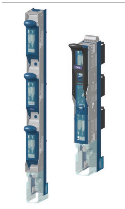
Obr. 1. Pojistkové lištové přístroje do 160 A

S takto vytvořeným seznamem jde dále pracovat – tisknout, vložit do objednávky apod. Lze také přímo upravovat počet položek s okamžitou odezvou ceny objednávky.