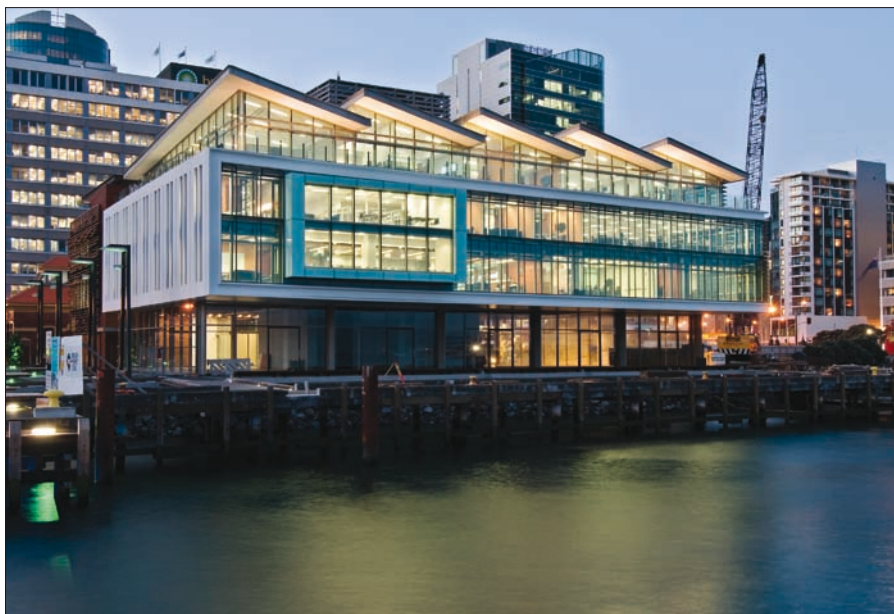
Obr. 1. Meridian Building, kancelářská budova oceněná za mimořádnou úspornost energie

Systém řízení osvětlení v Meridian Building využívá techniku rozhraní DALI (Digital Addressable Lighting Interface – digitální adresovatelné osvětlovací rozhraní), které určuje digitální spojení mezi řídicími jednotkami (routery – směrovači) a propojovacími zařízeními DALI (komponenty DALI). S použitím techniky DALI může být každé svítidlo v budově