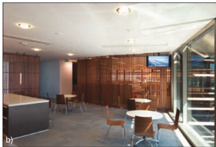
Obr. 2. Konferenční místnost (a) může být rozdělena na tři prostory; její pohyblivé stěny obsahují senzory, které propojí svítidla do menších nezávislých osvětlovacích skupin (b)