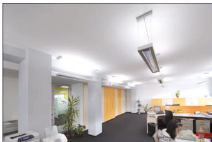
Obr. 2. Svítidla Serie 12 – osvětlení kancelářských prostor

V těchto prostorech je také vhodné použít přímo-nepřímé osvětlení; není zde ale kladen tak velký důraz na zábranu proti oslnění. Proto se může použít daleko hravější způsob osvětlování, a to pomocí opálových difuzorů i v kombinaci se zvýrazňujícím či nepřímým osvětlením. V těchto případech je vhodné zvolit svítidla ze sortimentu firmy Halla: Serie 03, 13, 14 anebo vybrat některé z již zmiňovaných svítidel Serie. Na obr. 3 je realizace ko-