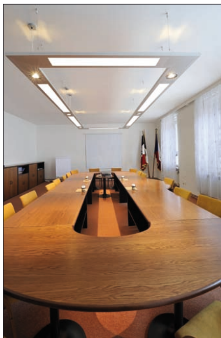
Obr. 1. Svítidla Serie 10 – osvětlení kancelářských prostor

S vývojem architektonického designu se stejnou rychlostí vyvíjí i přístup k osvětlování. S ohledem na nové trendy v tomto oboru výrobci přicházejí na trh se svítidly s novým způsobem distribuce světla