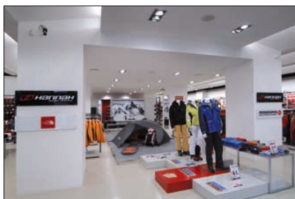
Obr. 4. Svítidla Serie 23 – nepřímé osvětlení v kombinaci se zvýrazňujícím osvětlením (realizace)