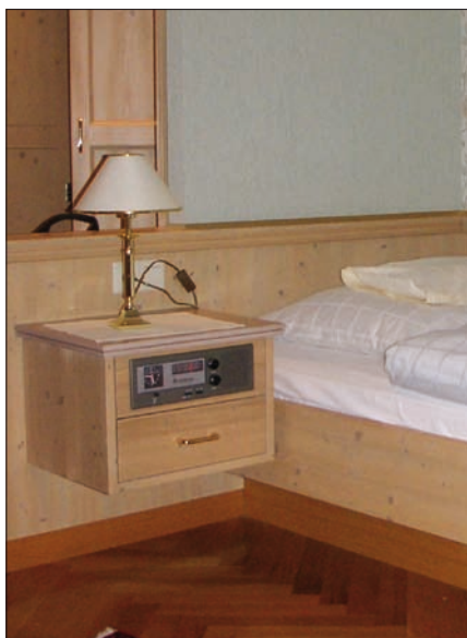
Obr. 3. Část jiného hotelového interiéru

režim vytápění a klimatizace a také používat spotřebiče zapojené do silových zásuvek. Pouze zásuvka určená pro připojení chladničky je připojena trvale, neboť je mimo obvody aktivované kartou.