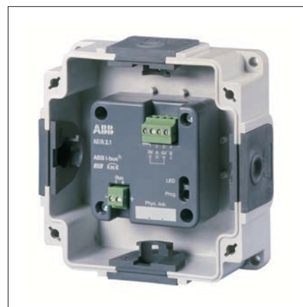
Obr. 7. Dvojnásobný analogový vstup

Využití těchto přístrojů v kancelářských a podobných prostorech zajistí stálou požadovanou úroveň osvětlení po ce-