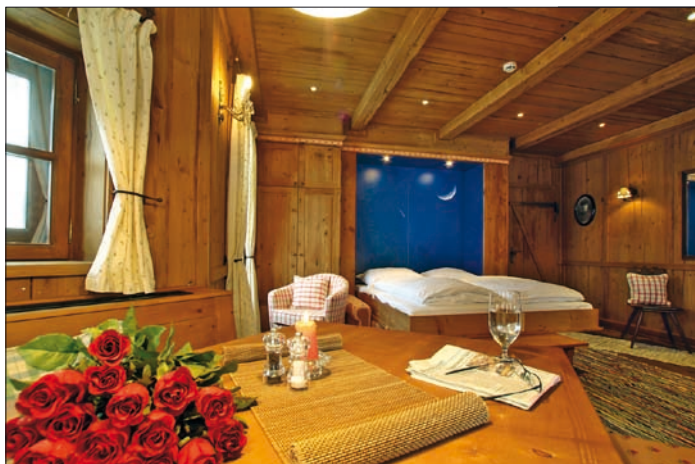
Obr. 2. Možné uspořádání interiéru ve stylovém hotelu

Především je požadováno spínání několika svítidel, obvykle i s možností centrálně je vypnout. V hotelových pokojích bývá velmi častým požadavkem možnost aktivovat instalaci tzv. kartovým spínačem. Hotelový host si otevře dveře magnetickou kartou a zasune ji do příslušného otvoru tohoto spínače (obr. 1). Tím se spojí kontakty vestavěného spínače a ten aktivuje elektrickou instalaci v pokoji i jeho příslušenství. V důsledku toho je možné ovládat osvětlení, žaluzie, měnit