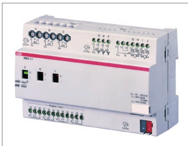
Obr. 5. Řídící jednotka Basic

20 A a jedním pro 16 A. Každý z dalších devíti spínaných kanálů lze zatěžovat proudem až 6 A. Nechybí ani výstupní kanál s přepínacím kontaktem 6 A pro ovládání žaluzií nebo závěsů a také 6A přepínač třírychlostního ventilátoru konvektoru. Následují výstupní obvody pro dvě elektrotepelné hlavice ventilů spínané polovodiči, z nichž jedna bude ovládat přívod topné kapaliny a druhá přívod chladicí kapaliny. Následuje osmnáctikanálový binární vstup pro tlačítkové ovladače a spínače určené k ovládání všech spínaných funkcí.