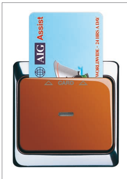
Obr. 1. Příklad kartového spínače

Některým investorům hotelů, bytových domů, domovů pro seniory, ale také nemocničních pokojů, přednáškových sálů a podobných staveb se zdají být náklady na systémovou elektrickou instalaci, která by komplexně řešila řízení provozu osvětlení, vytápění, chlazení a žaluzií v těchto objektech, příliš vysoké. Do sortimentu firmy ABB byly nyní zařaze-