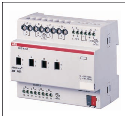
Obr. 6. Čtyřkanálový regulátor intenzity osvětlení

Pro řízení osvětlení na stálou osvětlenost především v komerčních objektech je určena nová řada regulátorů osvětlení, k nimž lze připojit externí snímače intenzity osvětlení připojené ke svorkám přístroje, programovatelné pro jednotlivé kanály. Podle potřeby je možné použít dvojnásobné, čtyřnásobné nebo osminásobné přístroje. Například čtyřnásobný přístroj (obr. 6) je vybaven čtyřmi spínanými výstupy 16 A a čtyřmi regulovanými výstupy 0 až 10 V DC pro připojení stmívatelných elektronických předřadníků vestavěných do zářivko-