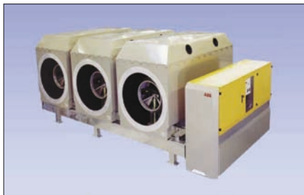
Obr. 1. Generátorový vypínač ABB, typ HEC3, instalovaný v teplárně Ško-Energo v automobilce v Mladé Boleslavi

Teplárna Ško-Energo v areálu automobilové továrny Škoda Auto a. s. v Mladé Boleslavi je jak klíčovým energetickým zdrojem elektrické a tepelné energie, tak také zdrojem stlačeného vzduchu. Vypínače slouží k připojení generátorů k transformátorům. Výkon