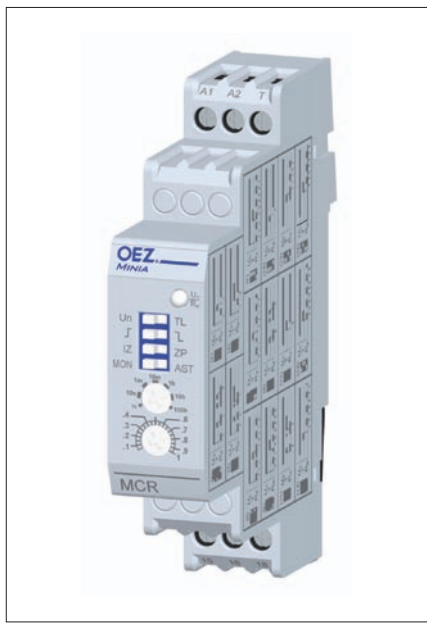
Obr. 5. Minia MCR

je OEZ. Vzhledem k tomu, že všechny přístroje Minia jsou svými rozměry shodné, či dokonce menší a je zachován či vylepšen způsob propojení, je tato náhrada standardně možná.