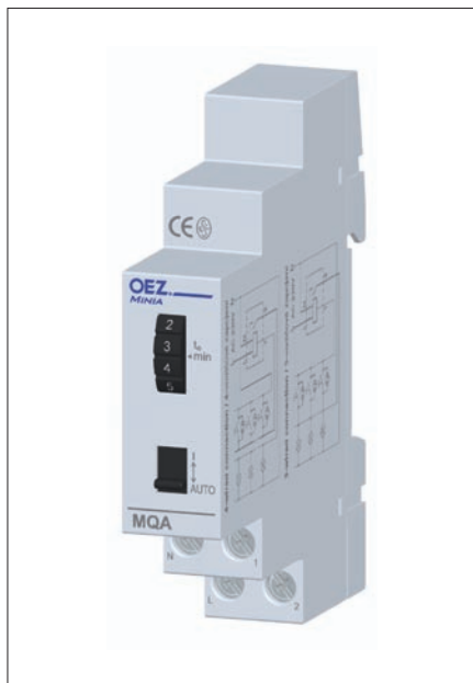
Obr. 4. Minia MQA