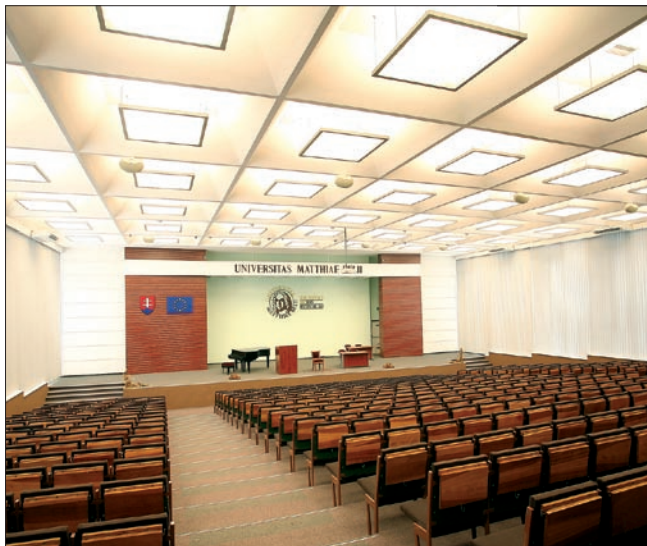
Obr. 1. Hlavná aula – celkový pohľad (Wega-A 6x 54 W)

Na projekte Aula-Univezita Mateja Bela v Banskej Bystrici firma SEC spolupracovala s firmou SLOS. Osvetlenie bolo navrhnuté tak, aby spĺňalo požiadavky stanovené platnými normami a súčasne poskytovalo svetelný komfort užívateľom a taktiež spĺňalo estetické požiadavky investora. Určujúcim faktorom pre výber svietidla bol aj tvar stropných panelov. Boli tu teda s výhodou použité svietidlá typovej rady Wega s kombináciou priameho a nepriameho osvetlenia. Na osvetlenie hlavnej sály bolo zvolených 70 závesných svietidiel Wega-A-Prisma-