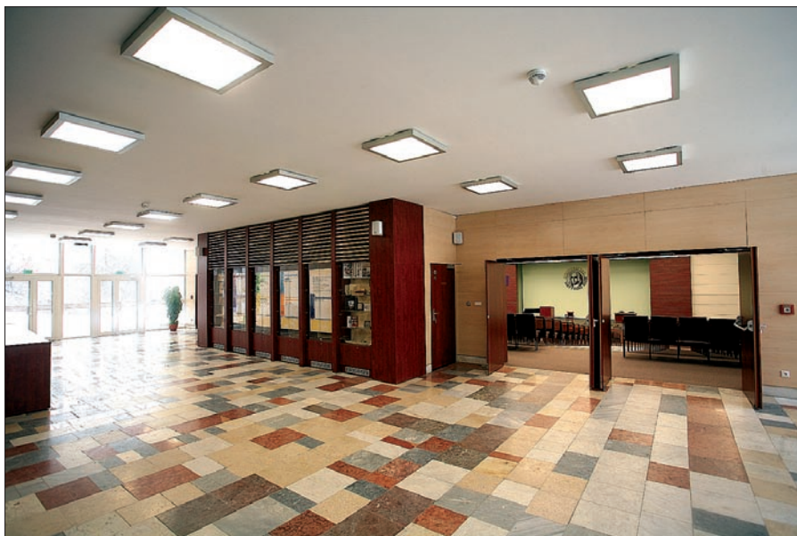
Obr. 3. Aula, vstupný priestor (Wega-C 4x 14 W)

svietidlá z vlastnej produkcie aj pre ďalší z mnoha iných zaujímavých projektov, pre Autosalón Mazda-Mitsubishi-Hyundai v Bratislave. Určujúcim faktorom pre výber svietidiel bola vysoká architektonická úroveň stavby, využívajúca najnovšie prvky a technické poznatky z viacerých odborov v stavebníctve. Preto sa firma SEC rozhodla pre svietidlá, ktoré boli dizajnovane kompatibilné s komplexným riešením interiéru. Celkovo bolo použitých viac ako 650 svietidiel typovej rady Wega-Module vo verziách s montážou na záves