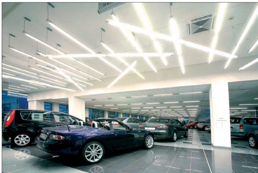
Obr. 4. Autosalón – predajňa Mazda (Wega-Module-A)