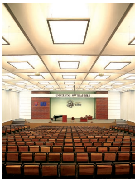
Obr. 2. Hlavná aula – celkový pohľad (Wega-A 6x 54 W)

Firma SEC s. r. o. je známa ako tradičný výrobca núdzových svietidiel, ale už menej ako výrobca širokého sortimentu moderných a vysokokvalitných interiérových svietidiel. Už v roku 2000 padlo rozhodnutie orientovať sa na architektonické osvetlenie a naplno tým využiť high-tech vývojový a výrobný potenciál firmy. Výsledkom úsilia špecialistov firmy SEC je v súčasnosti výrobný sortiment pozostávajúci z 1 400 rôznych svietidiel, z čoho približne 35 % tvoria interiérové svietidlá. Tie sú veľmi často navrhnuté a vyrobené