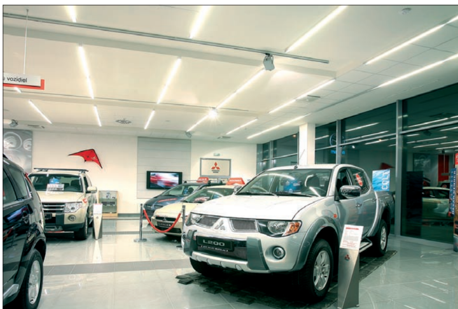
Obr. 6. Autosalón – predajňa Mitsubishi (Wega-Module-A 1 × 54 W)

alebo priamo prisadené, osadené progresívnymi svetelnými zdrojmi T5, v rôznej dĺžke. Podarilo sa sklbiť protichodné požiadavky na výkonné rovnomerné osvetlenie, ktoré nijako rozmerovo a tvarovo nenaruša celkový ráz interiéru s ohľadom na jeho využitie. Teleso svietidla je vyrobené z extrudovaného hliníkového profilu (v priereze len 50 × 50 mm) povrchovo upraveného eloxovaním. To dovoľuje vyrábať svietidlá rôznej dĺžky a spájať ich do súvislých línií, čo bolo naplno využité aj v tomto prípade, kde projektant požadoval aj neštandardné dĺžky modulov až do 4 m (firma SEC môže dodať svetelný modul vyrobený z jedného kusu profilu v dĺžke až 7,3 m). Všetky svietidlá boli vybavené prizmatickým difúzorom